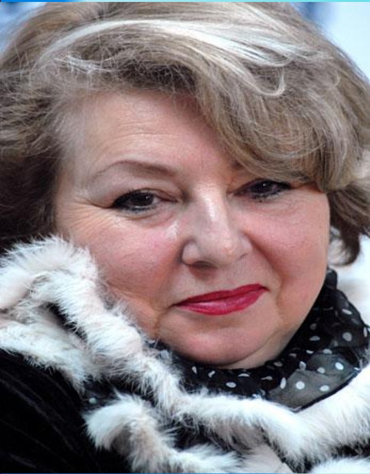
Тарасова Татьяна Анатольевна