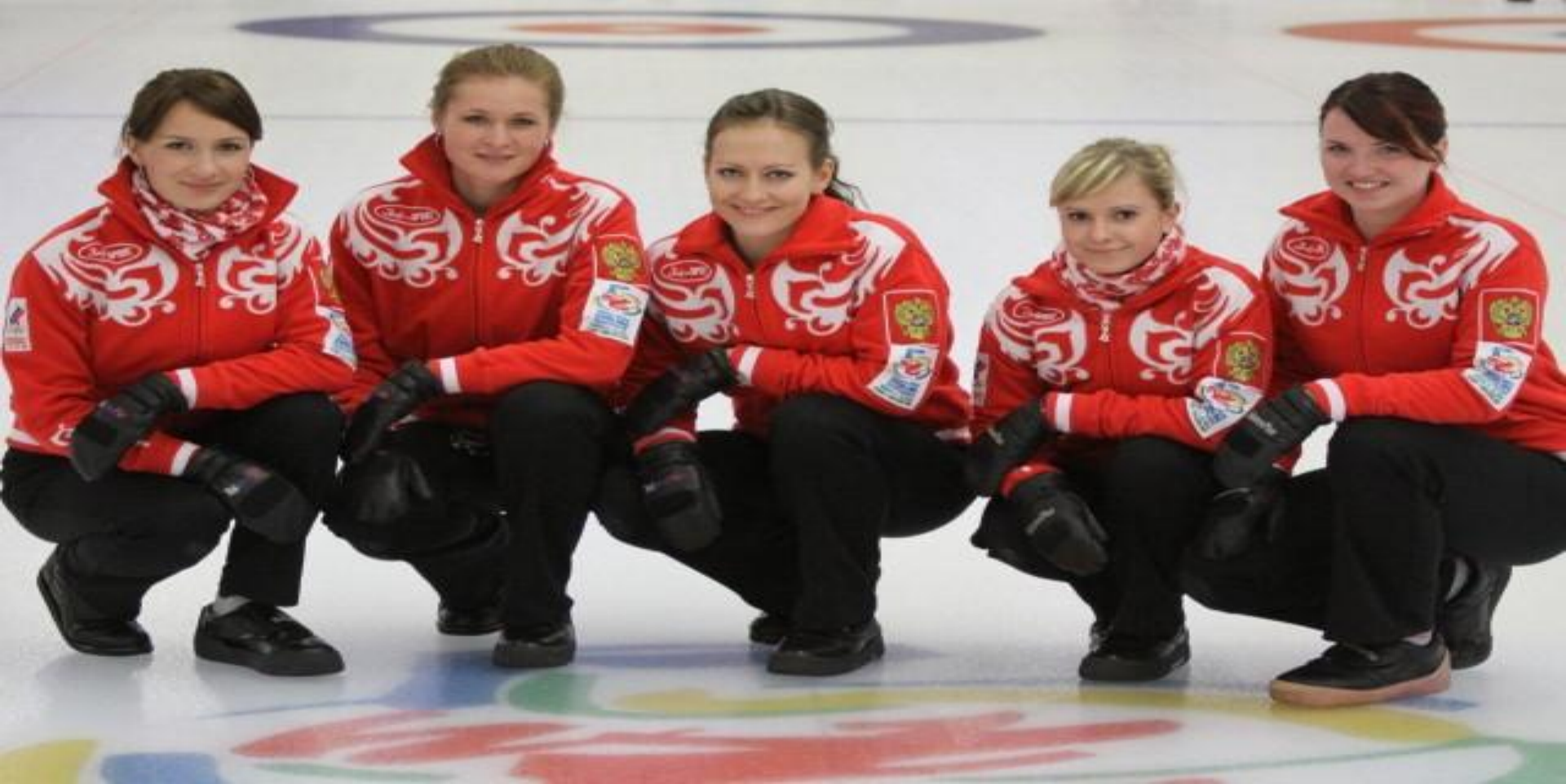
Сборная России по керлингу