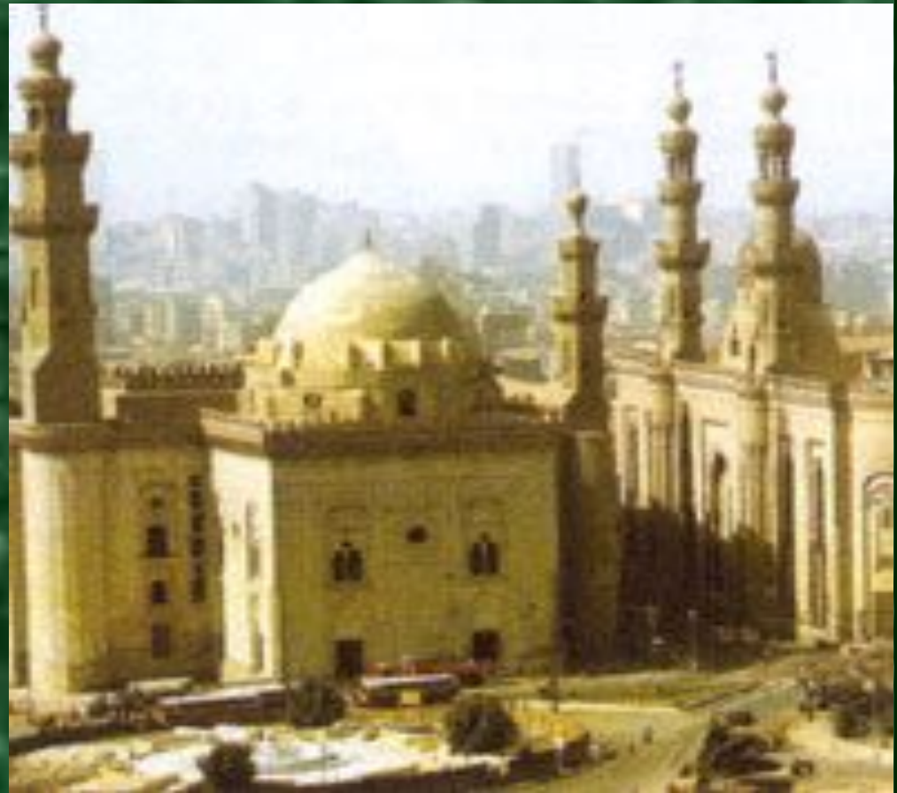
Мечеть (молитвенное здание)

Он родился в Мекке в 570 г. Мухаммед принадлежал к обедневшему роду хашим. Рано осиротев, он жил в семье своего деда, потом дяди. У него были трудные детство и юность: он пас овец, в 25 лет сопровождал караваны.