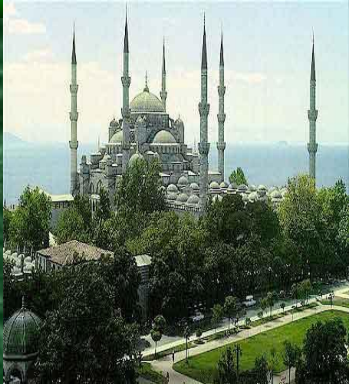
Мечеть (молитвенное здание)