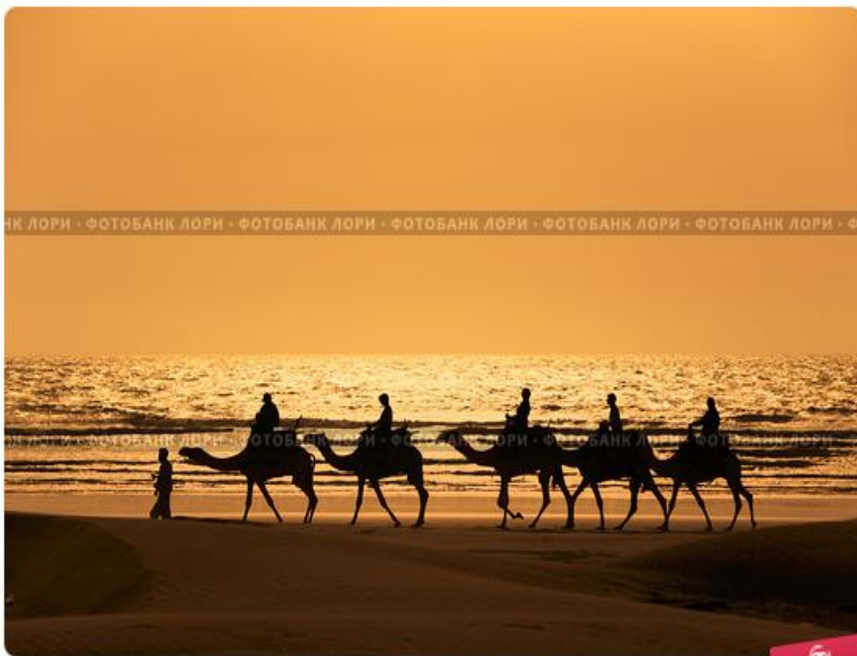
Силуэты людей на верблюдах идущих вдоль берега океана на закате солнца

Через купцов он познакомился с религиями, а женитьба на богатой вдове Хадидже позволила ему заниматься тем, к чему он был призван: осмысление религиозных проблем, проблем жизни общества.