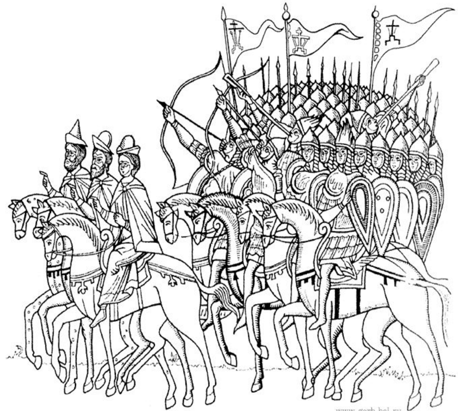
Стяги новгородской дружины XIII в. на иконе “Битва новгородцев с суздальцами”. Новгород, XV в. Прорисовка А. Г. Силаева.

Приводим прорисовку А.Г. Силаева с иконы “Благословенно воинство Царя Небесного” (фрагмент “Битва новгородцев с суздальцами”). Новгород, XV в.