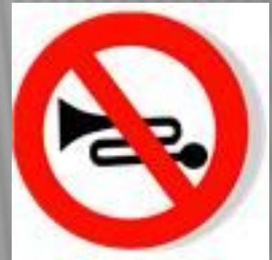
Подача звукового сигнала запрещена