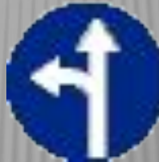
Движение прямо или налево