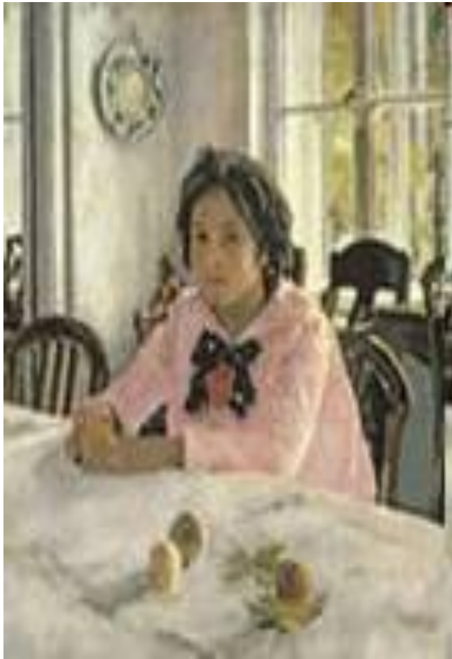
Девочка с персиками