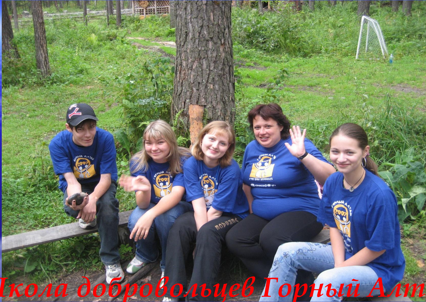
Школа добровольцев Горный Алтай Делегация города Березовского.