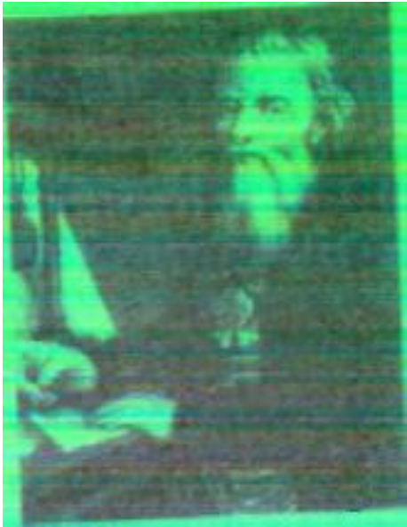
И. П. Кулибин (1735-1818).

И. П. Кулибин выдающийся русский механик изобретатель, более тридцати лет руководил механической мастерской Петербургской академии наук.