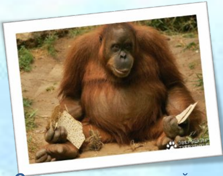
Орангутанг – «лесной человек»