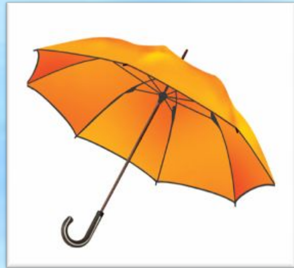
Зонтик – zondek – «покрышка от солнца»