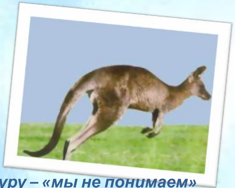
Кенгуру – «мы не понимаем»