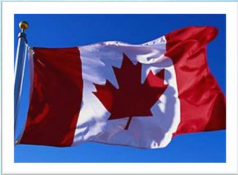
Канада – «хижины»