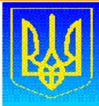
Герб Украины Президент Украины