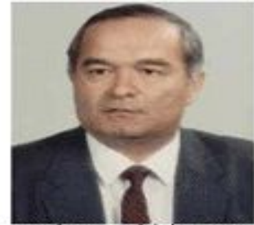
Президент Республики Узбекистан