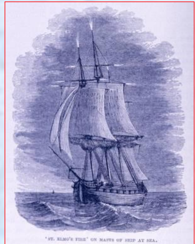
ST. ELMO'S FIRE ON MASTS OF SHIP AT SEA.

- разряд в форме светящихся пучков или кисточек, возникающих на острых концах высоких предметов (башни, мачты, одиноко стоящие деревья, острые вершины скал и т. п.) при большой напряжённости электрического поля в атмосфере. Название явление получило от имени покровителя моряков в католической религии.