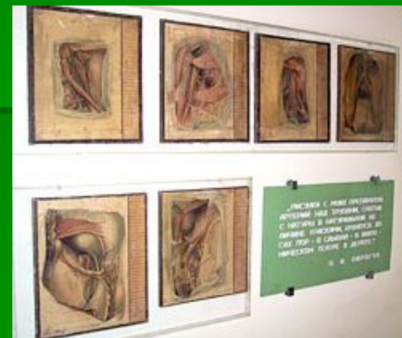
Рисунки с препаратов Н.И. Пирогова, худ.