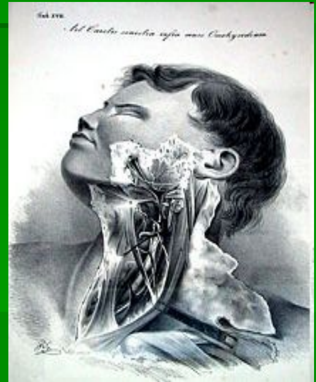
Таблица из атласа Н.И. Пирогова "Хирургическая анатомия артериальных стволов и фасций". Дерпт. 1836г.