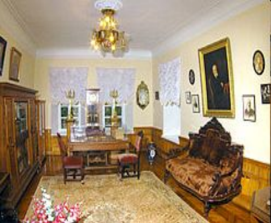
Рабочий кабинет Н.И. Пирогова