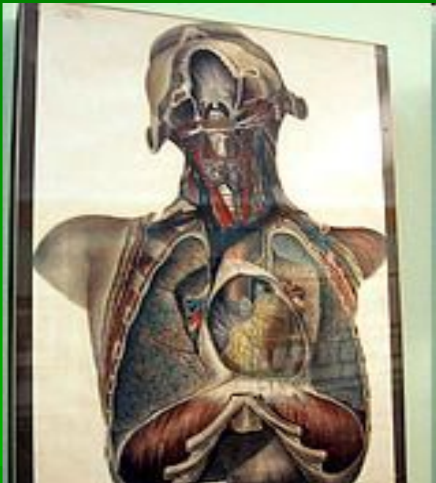
Таблица из Атласа Н.И. Пирогова