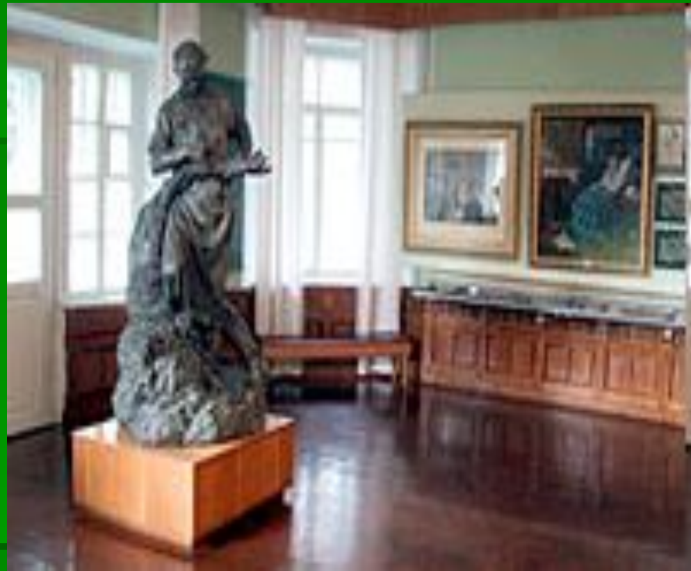
На переднем плане скульптурная композиция "Пирогов и матрос". Скульптор В.М. Друзин