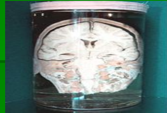
Анатомический препарат, изготовленный Н.И. Пироговым

Совместно с профессорами К.М. Бером и К. К. Зейдлицем Н.И. Пирогов разработал проект создания при академии Анатомического института, в котором врачи и студенты имели бы возможность совершенствовать свои знания из анатомии и хирургии.