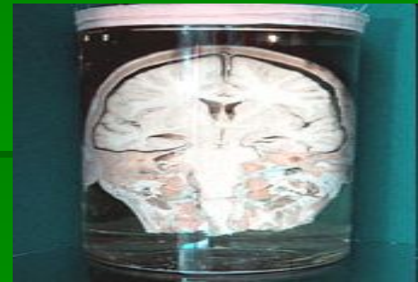
Анатомический препарат, изготовленный Н.И. Пироговым