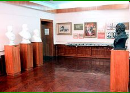
Фрагмент экспозиции музея

Жизнь и деятельность выдающегося ученого, гениального врача, педагога и общественного деятеля Николая Ивановича Пирогова оставили глубокий след в истории отечественной науки и культуры. Они проникнуты неиссякаемой любовью к Отечеству, своему народу и являются примером служения идеалам добра, правды, гуманизма. Последние 20 лет Н.И. Пирогов прожил в своей усадьбе Вишня, недалеко от города Винница. 9 сентября 1947 года здесь открыт музей.