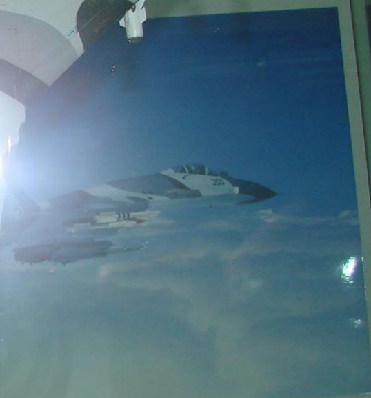
Су - 27СКМ