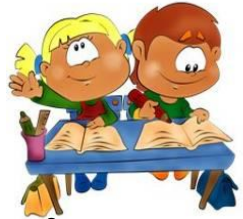
Занятия в школе