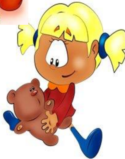
Игры перед сном