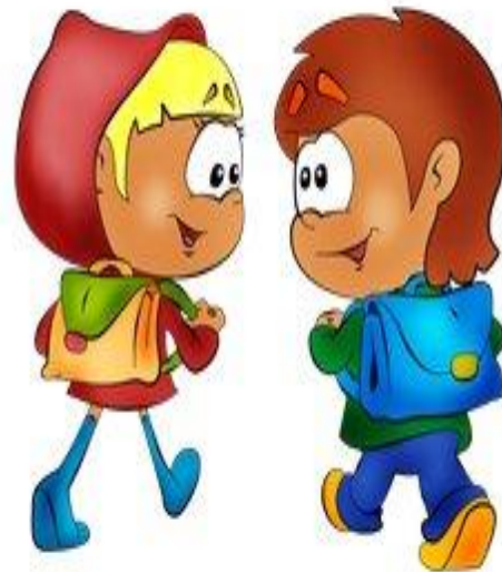
Дорога в школу