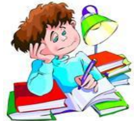
Подготовка к урокам