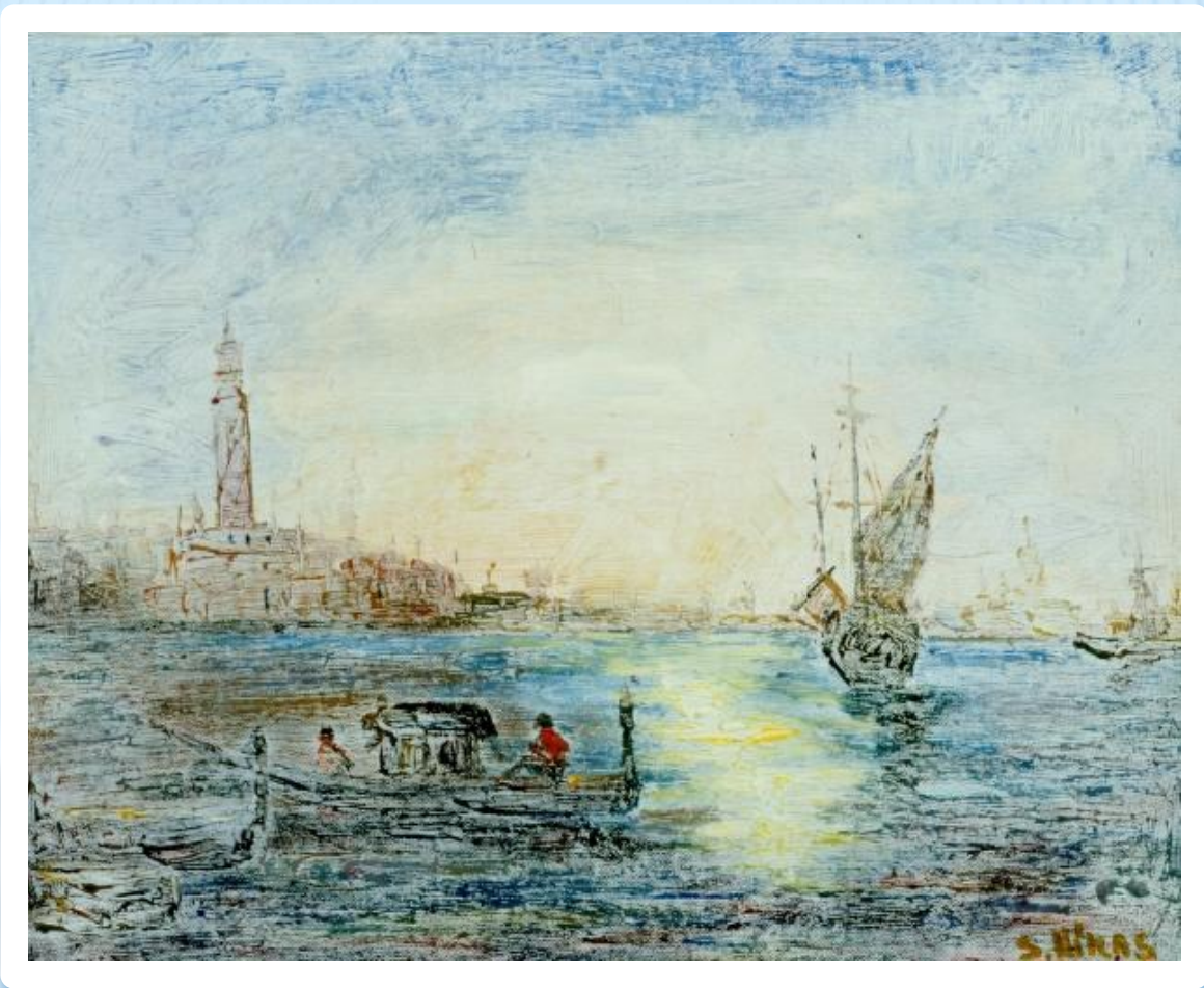
Парусник у пристани