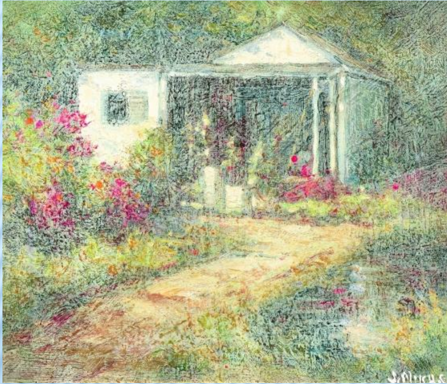
Летний день в стиле импрессионистов