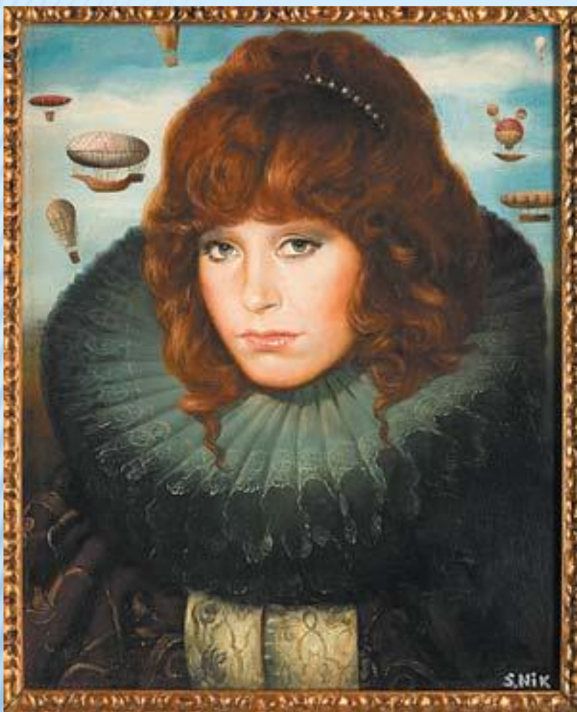
Этот портрет Примадонны Никас Сафронов назвал «Арлекино истории» (1998)