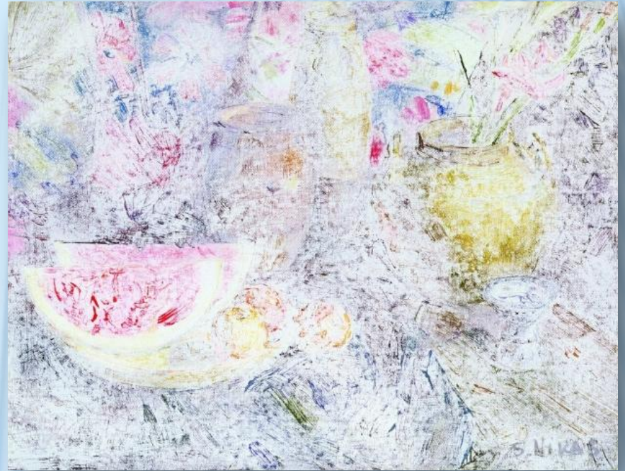
Натюрморт с арбузом