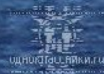
Бегущая по волнам.