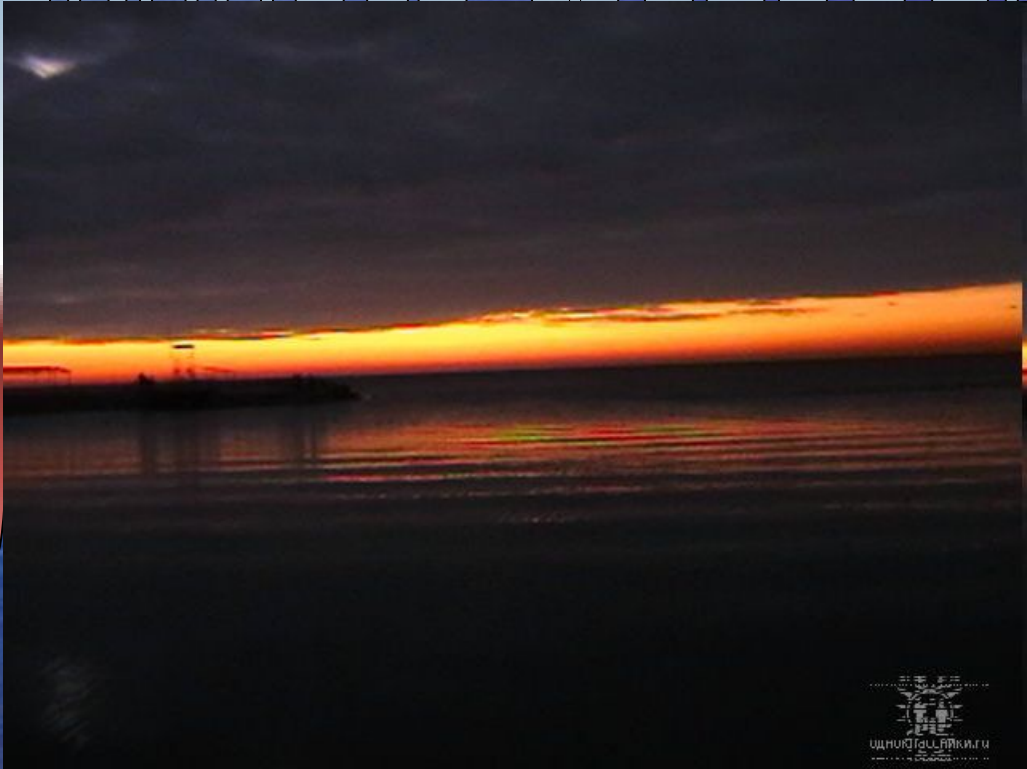
Анапа, октябрь 2008г.