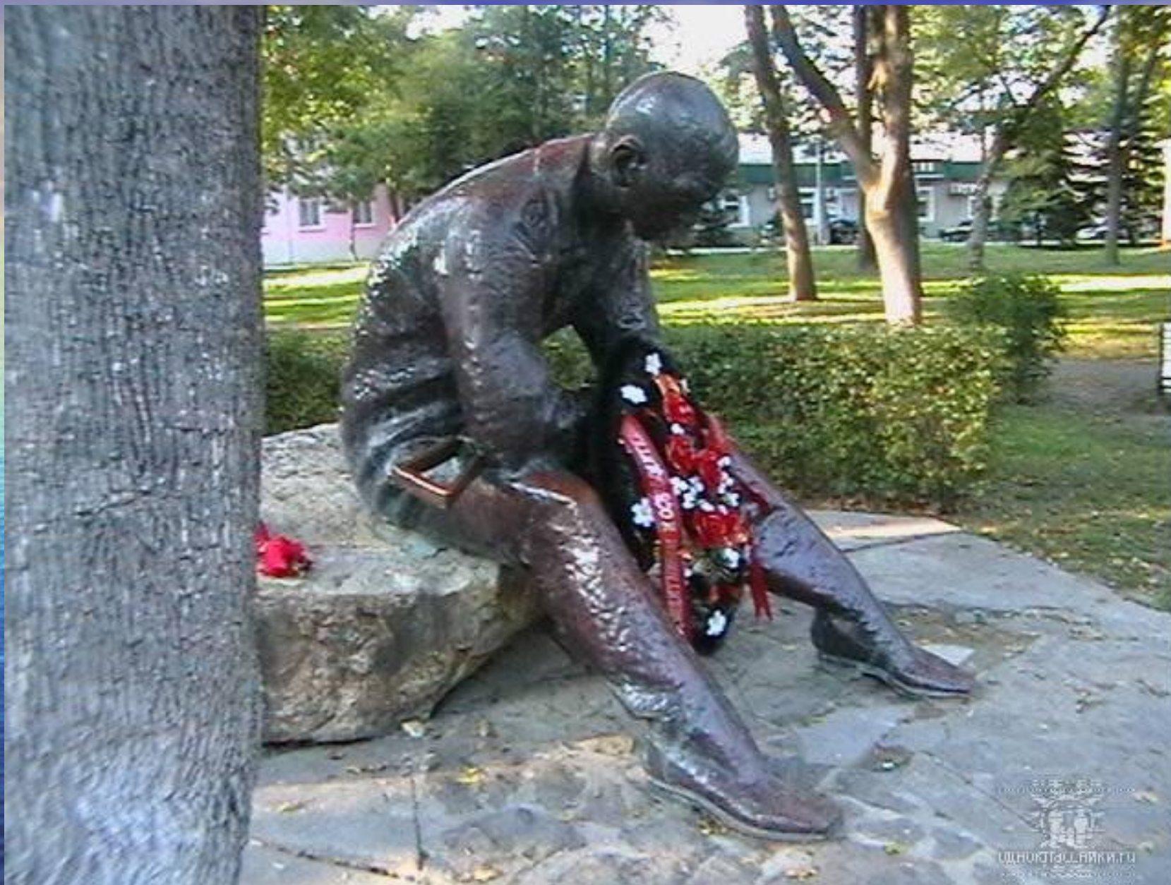
Памятник солдатам, погибшим в Афганистане.