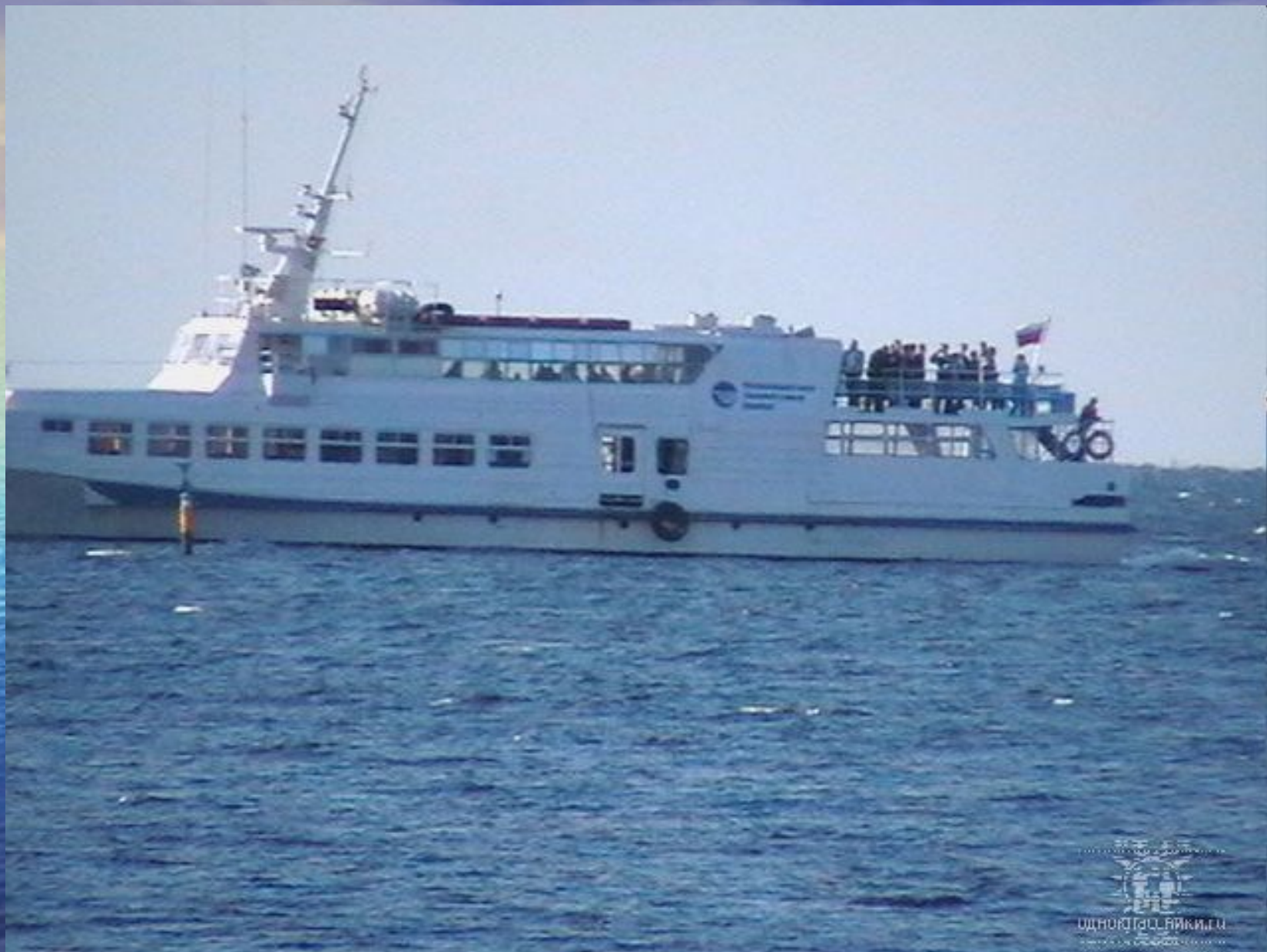
Прогулка по морю.