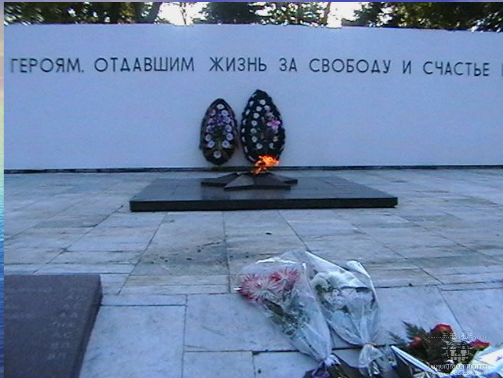
У вечного огня.