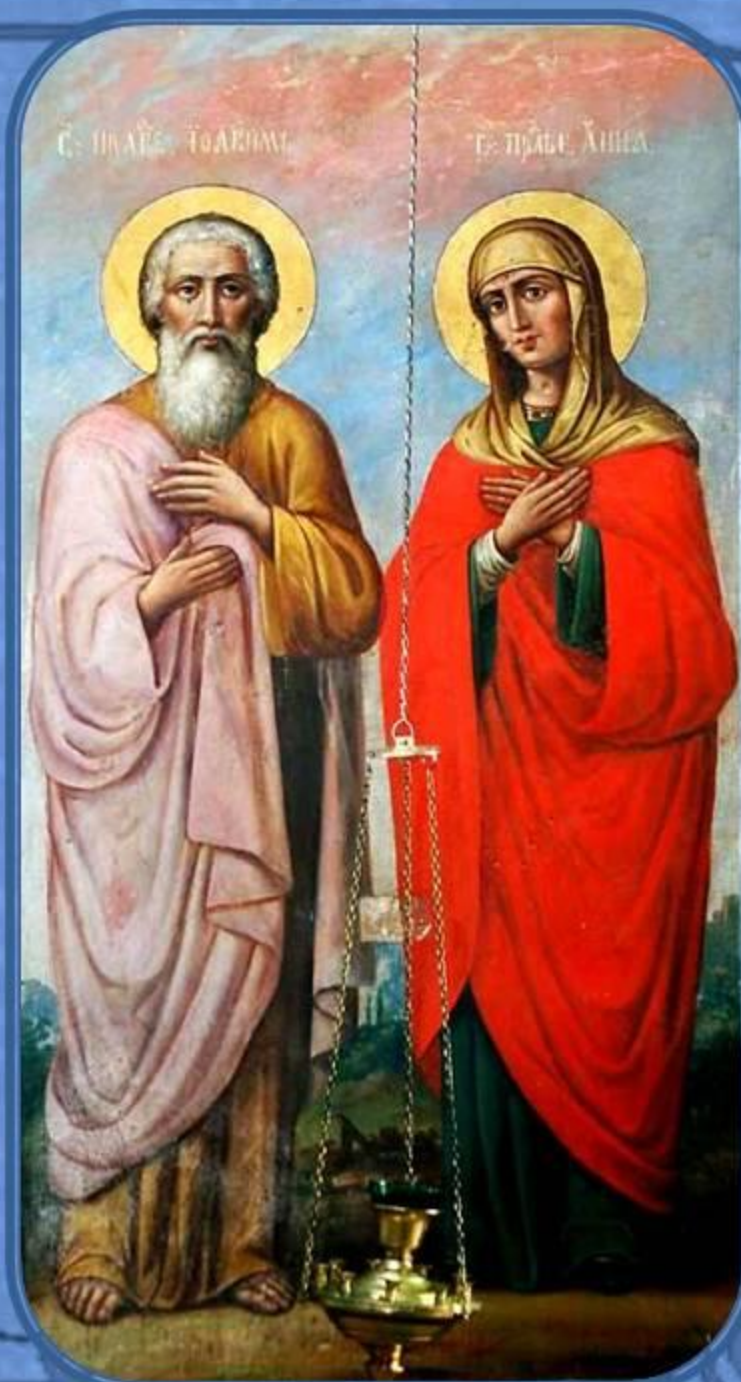
Праведные Иоаким и Анна

Оба они были люди праведные и были известны не своим царским происхождением, а смирением и милосердием.