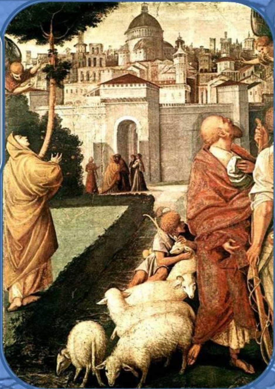
Гауденцио Феррари. Благовещение Иоакиму и Анне

Поэтому, несмотря на свою старость, Иоаким и Анна не переставали просить у Бога, чтобы Он даровал им дитя.