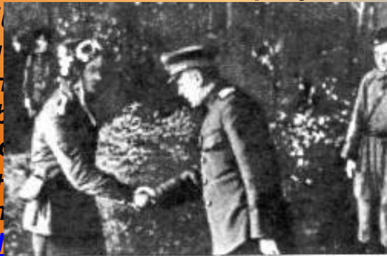
А.Новиков поздравляет Маресьева с присвоением звания Героя Советского Союза

20 июля 1943 года Алексей Маресьев во время воздушного боя с превосходящими силами противника спас жизни 2 советских лётчиков и сбил сразу два вражеских истребителя Fw.190, прикрывавших бомбардировщики Ju.87. Боевая слава о Маресьеве разнеслась по всей 15-й Воздушной армии и по всему фронту. В полк зачастили корреспонденты, среди них был будущий автор книги «Повесть о настоящем человеке» Борис Полевой . 20 июля 1943 года Алексей Маресьев во время воздушного боя с превосходящими силами противника спас жизни 2 советских лётчиков и сбил сразу два вражеских истребителя и бомбардировщики Ju.87. Боевая слава о Маресьеве разнеслась по всей 15-й Воздушной армии и по всему фронту. В полк зачастили корреспонденты, среди них был будущий автор книги «Повесть о настоящем человеке» Борис Полевой . 24 августа 1943 года Маресьеву присвоено звание Героя Советского Союза за спасение жизни двух лётчиков и уничтожение двух вражеских истребителей и бомбардировщика.