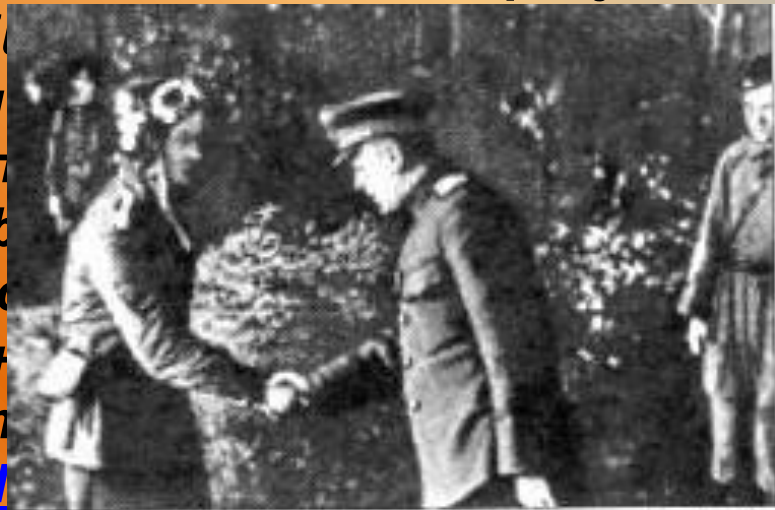
А.Новиков поздравляет Маресьева с присвоением звания Героя Советского Союза

20 июля 1943 года Алексей Маресьев во время воздушного боя с превосходящими силами противника спас жизни 2 советских лётчиков и сбил сразу два вражеских истребителя Fw.190, прикрывавших бомбардировщики Ju.87. Боевая слава о Маресьеве разнеслась по всей 15-й Воздушной армии и по всему фронту. В полк зачастили корреспонденты, среди них был будущий автор книги «Повесть о настоящем человеке» Борис Полевой . 20 июля 1943 года Алексей Маресьев во время воздушного боя с превосходящими силами противника спас жизни 2 советских лётчиков и сбил сразу два вражеских истребителя и бомбардировщики Ju.87. Боевая слава о Маресьеве разнеслась по всей 15-й Воздушной армии и по всему фронту. В полк зачастили корреспонденты, среди них был будущий автор книги «Повесть о настоящем человеке» Борис Полевой . 24 августа 1943 года Маресьеву присвоено звание Героя Советского Союза за спасение жизни двух лётчиков.