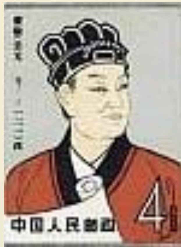
Цай Лунь, изобретатель бумаги