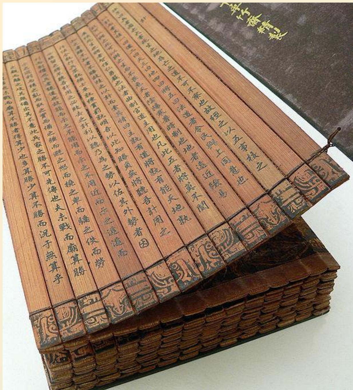
КНИГА ИЗ БАМБУКА