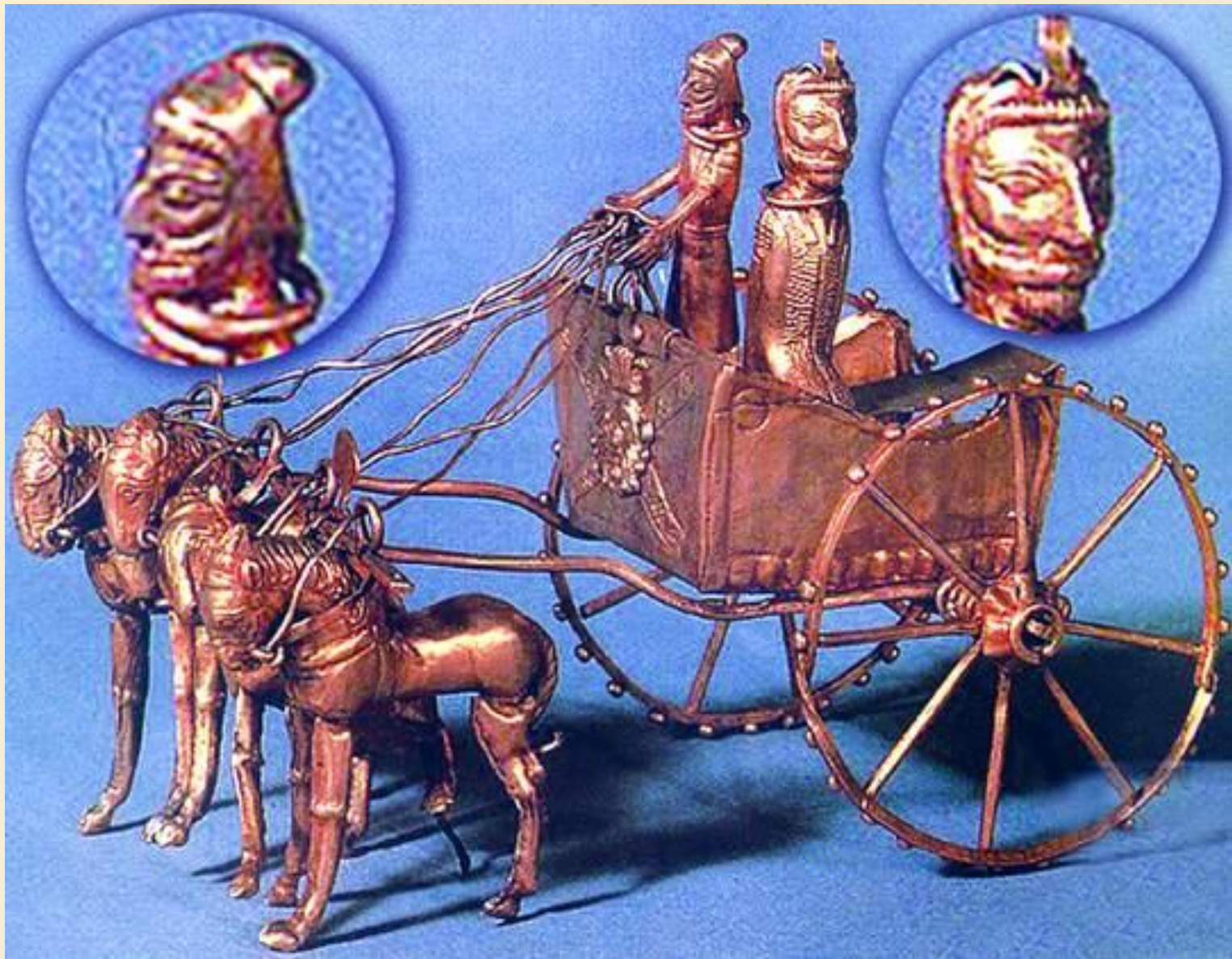
Колесницы 2-го тыс. до н.э.