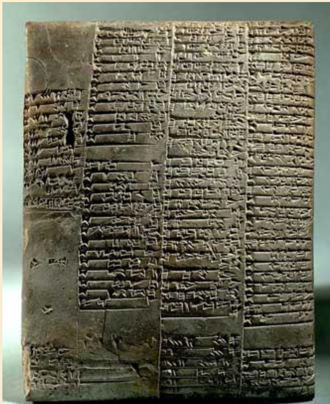
ШУМЕРСКАЯ ГЛИНЯНАЯ КЛИНОПИСНАЯ ТАБЛИЧКА (3500 до н. э.).