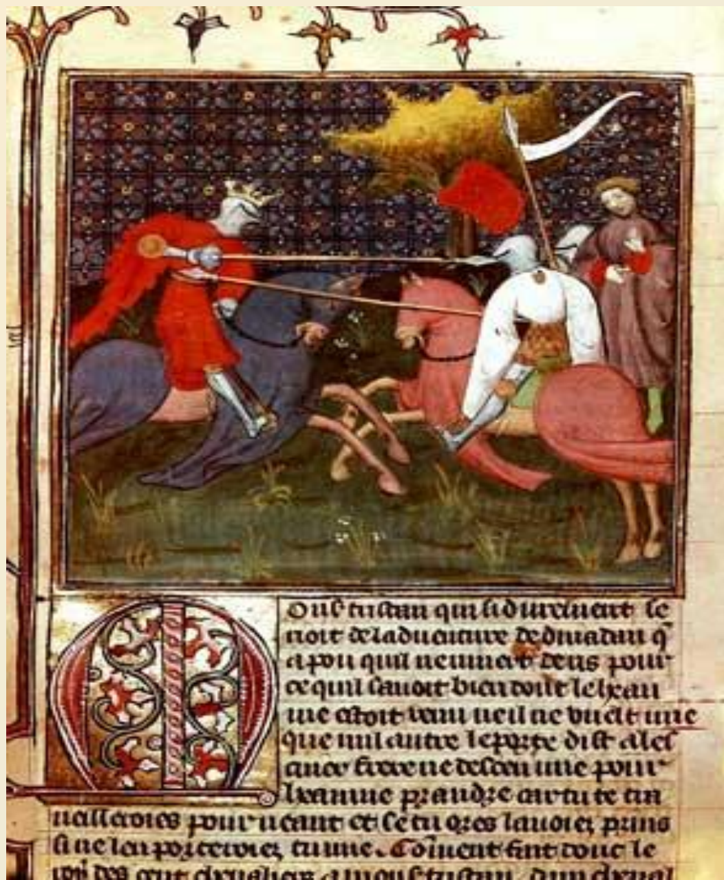
РЫЦАРСКИЙ ТУРНИР (книга 15 в., написанная на пергаменте).