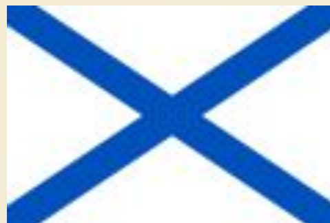
Флаг кораблей и судов ВМФ Росси