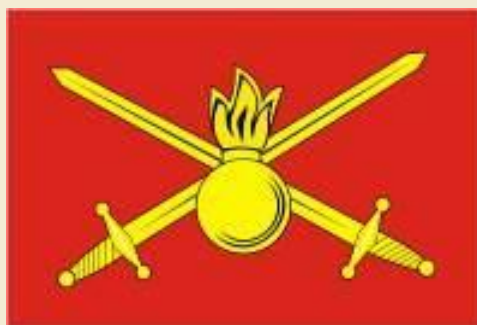
Флаг Сухопутных войск РФ