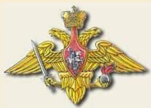
Средняя эмблема Сухопутных войск РФ