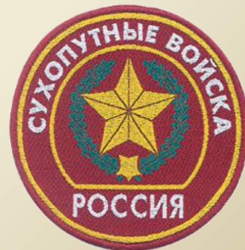
Нарукавный знак Сухопутных войск РФ