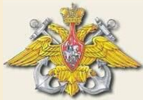
Эмблема ВМФ Росси