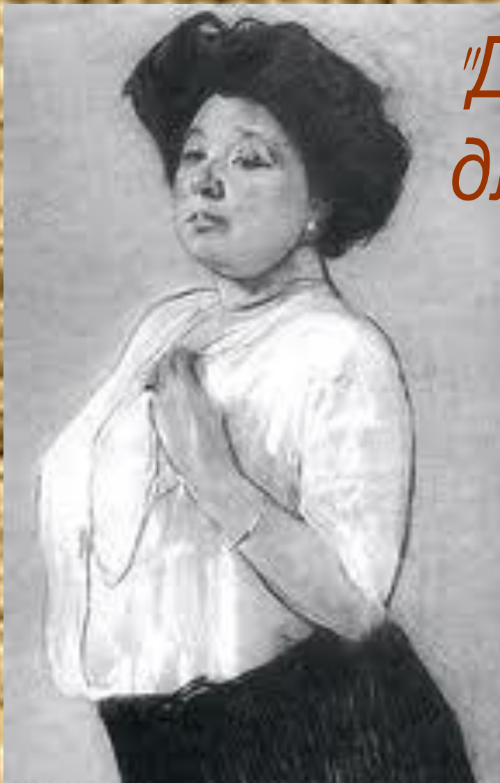
Надежда Петровна Ламанова (1861- 1941г.г)

"Для чего создается к для кого, из чего"