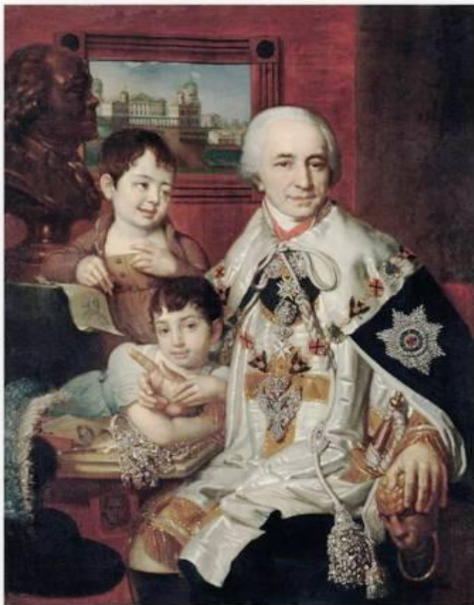
Портрет графа Г. Г. Кушелева в орденском одеянии и со знаком ордена Св. Андрея Первозванного с бриллиантами на орденской цепи.