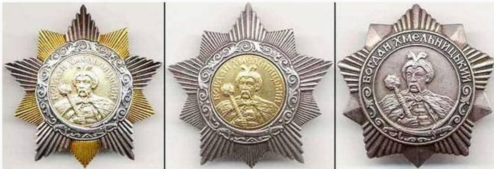
Орден Богдана Хмельницкого (1-2-3 степени)