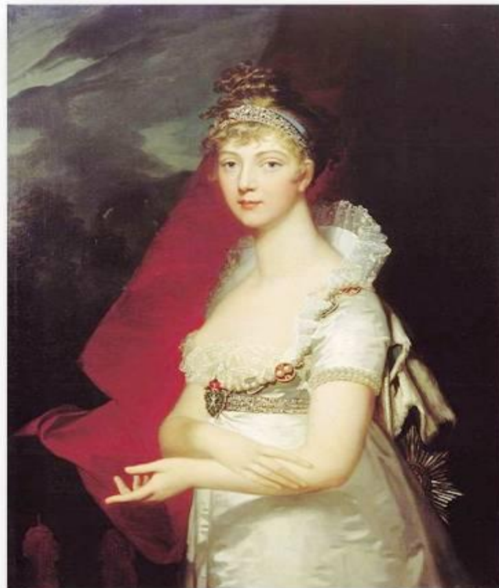
Портрет Елизаветы Алексеевны, жены Александра I, со знаком ордена Св. Андрея Первозванного на орденской цепи.