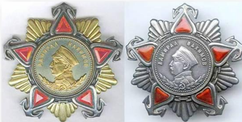
Орден Нахимова (1-2 степени)