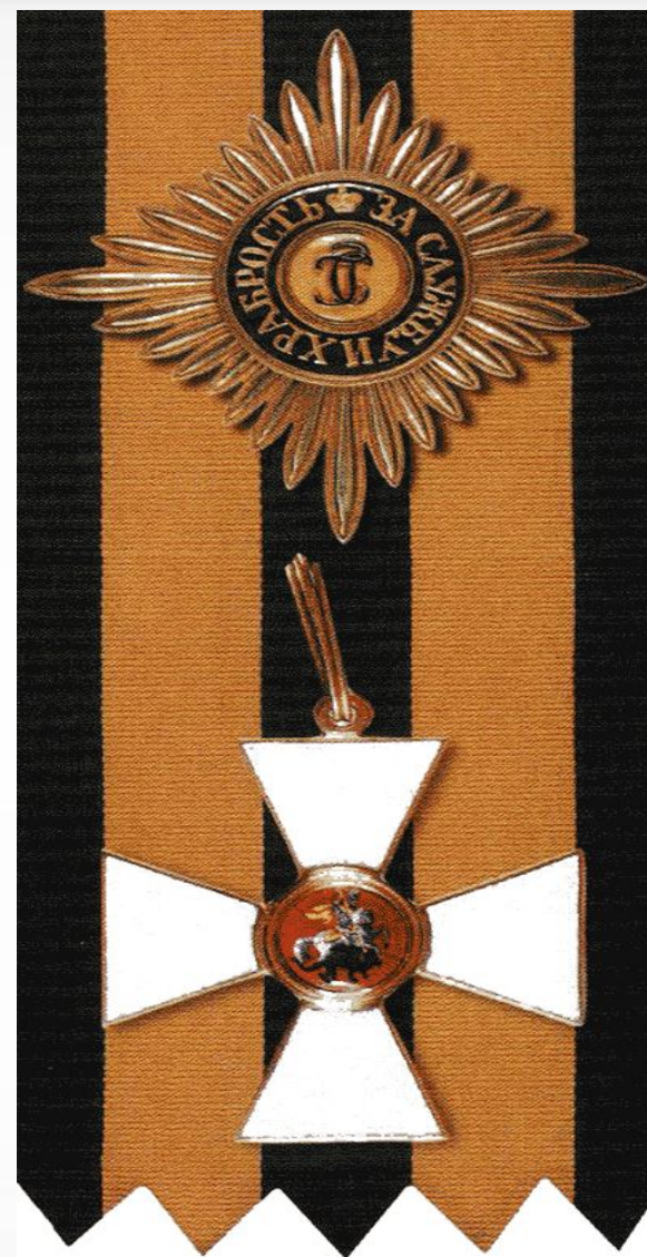
Орден и знак Святого Георгия