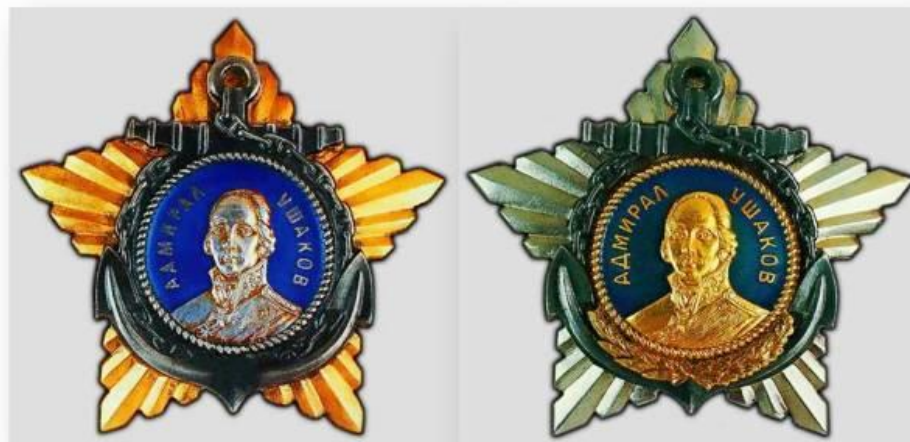
Орден Ушакова (1-2 степени)