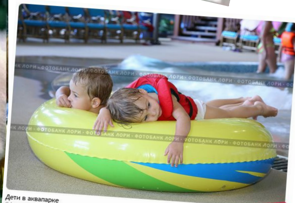
Дети в аквапарке