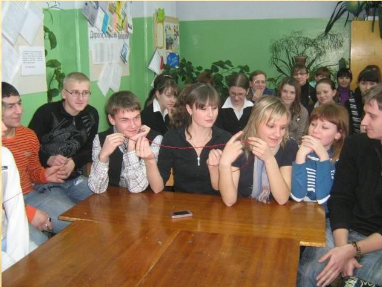
Профориентационная игра «Перспектива успеха» Встреча выпускников разных лет со старшеклассниками МОУ СОШ № 1 г.Окуловка