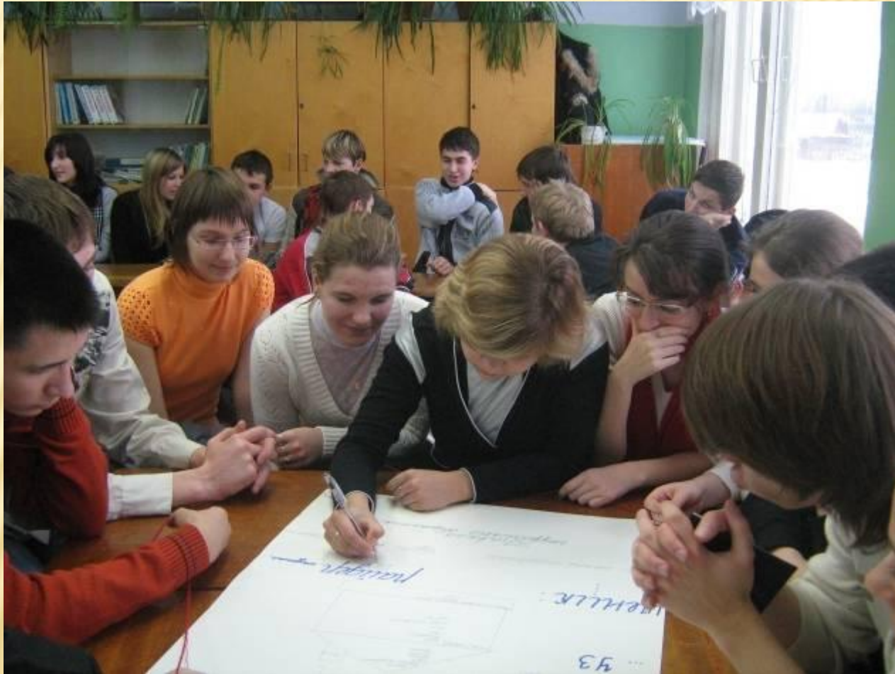
Профориентационная игра «Перспектива успеха» Встреча выпускников разных лет со старшеклассниками МОУ СОШ № 1 г.Окуловка