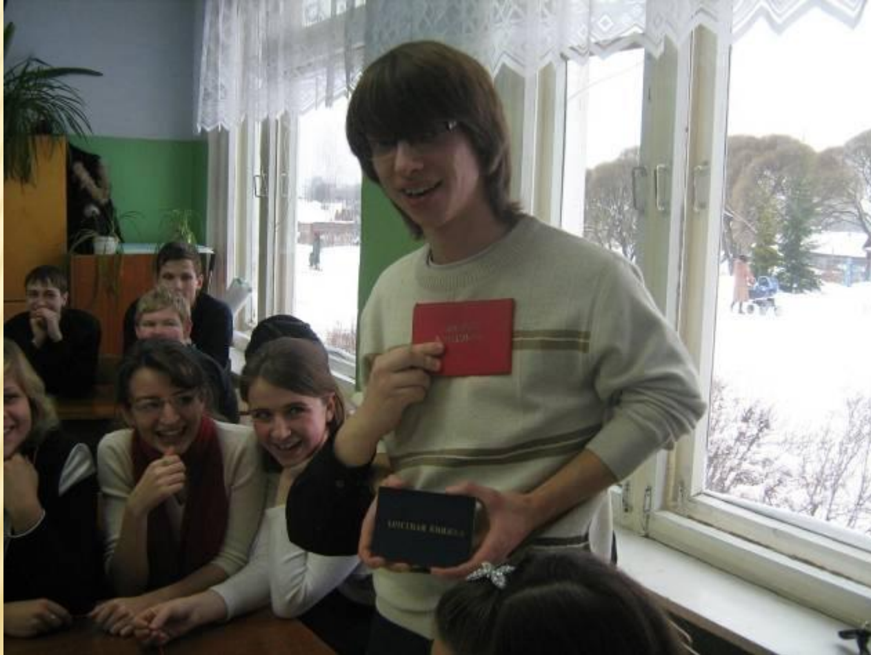
Встреча выпускников разных лет со старшеклассниками МОУ СОШ № 1 г.Окуловка