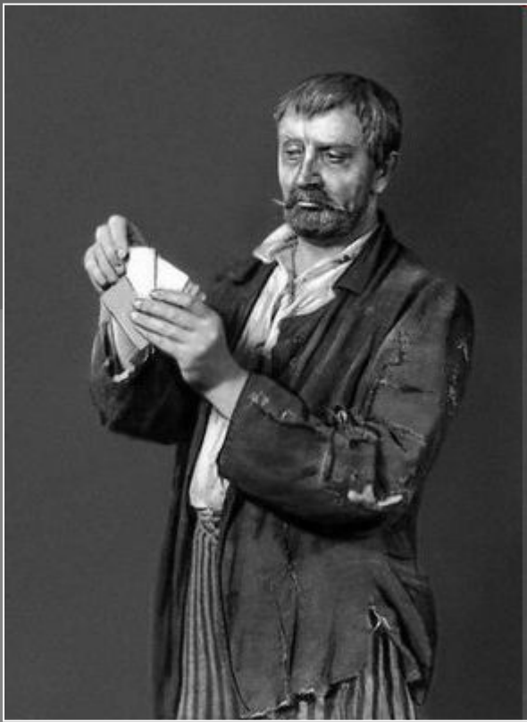
В. И. Качалов в роли Барона ("На дне" М. Горького)