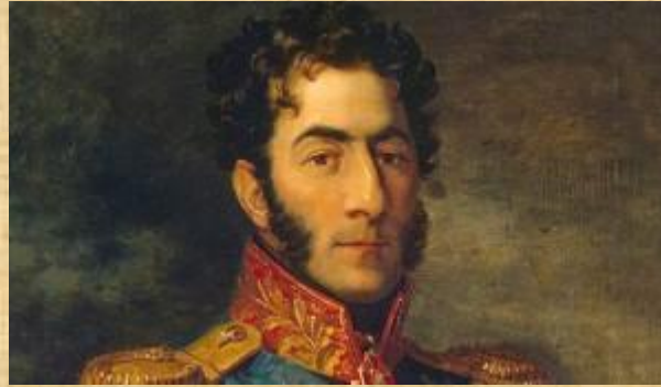
П. И. Багратион