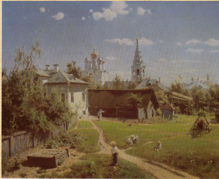
Поленов В.Д. Московский дворик