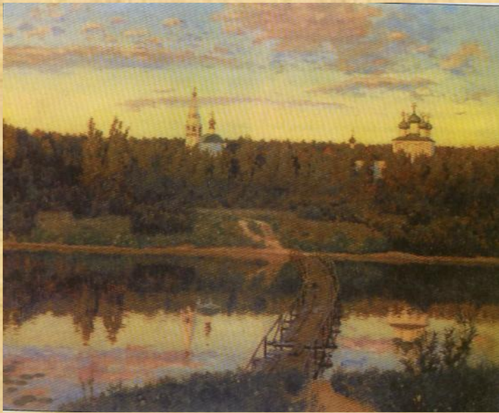
Исаак Левитан. Тихая обитель