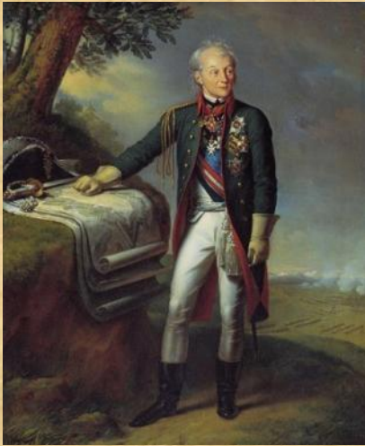
А. В. Суворов