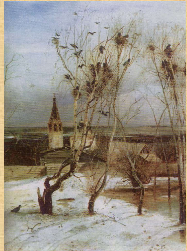
Алексей Саврасов. Грачи прилетели