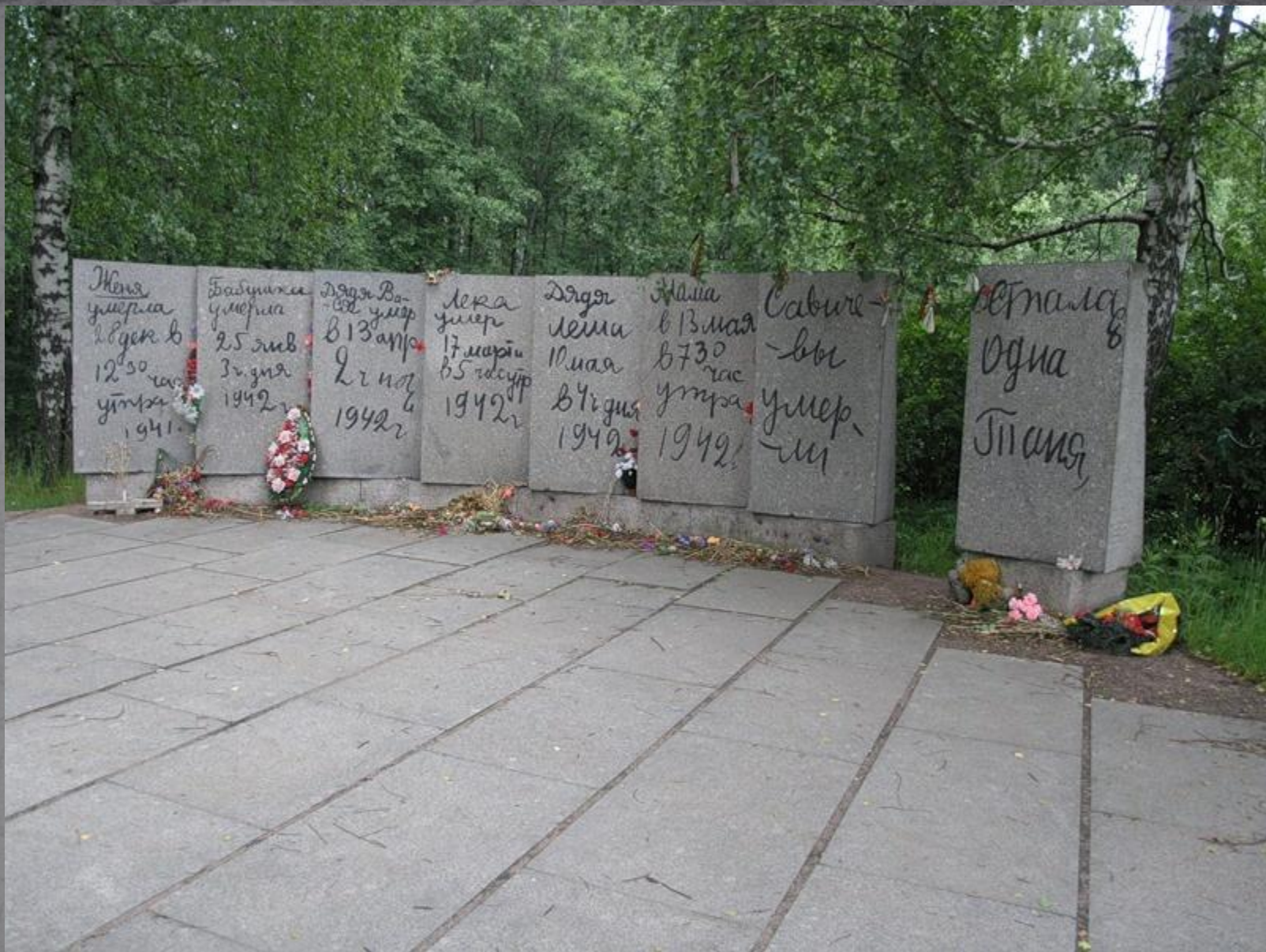
Дневник Тани Савичевой, в память о блокаде Ленинграда.