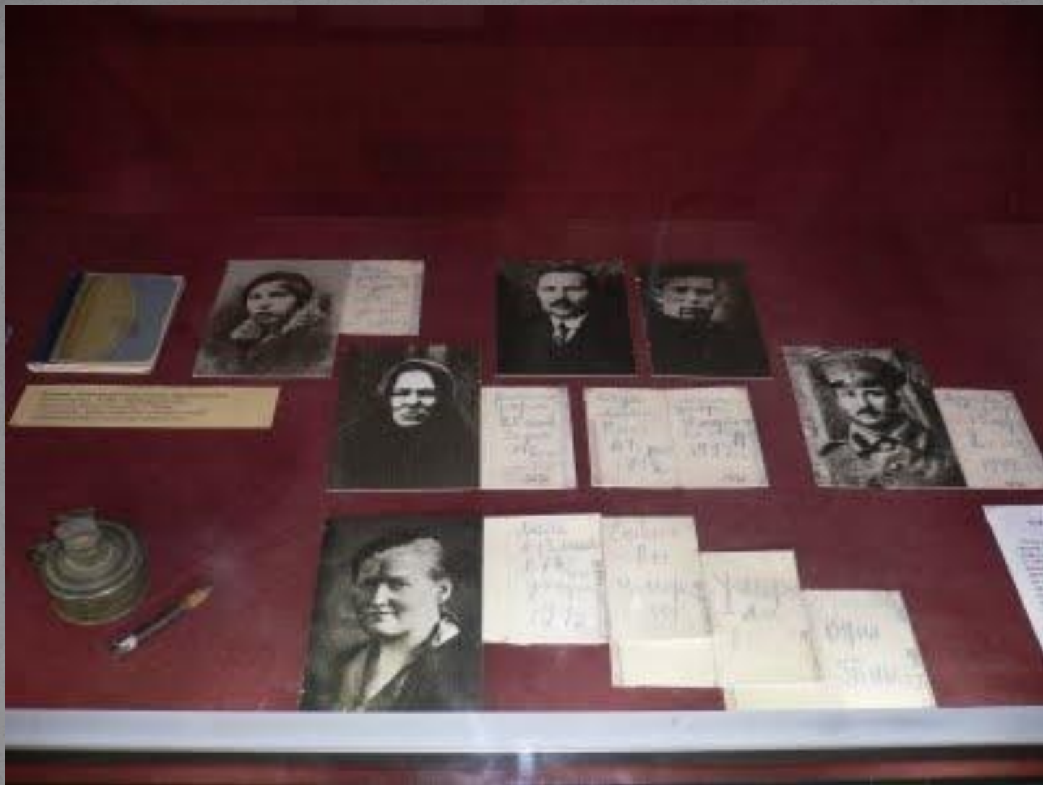
Дневник Тани Савичевой выставлен в Музее истории Ленинграда..