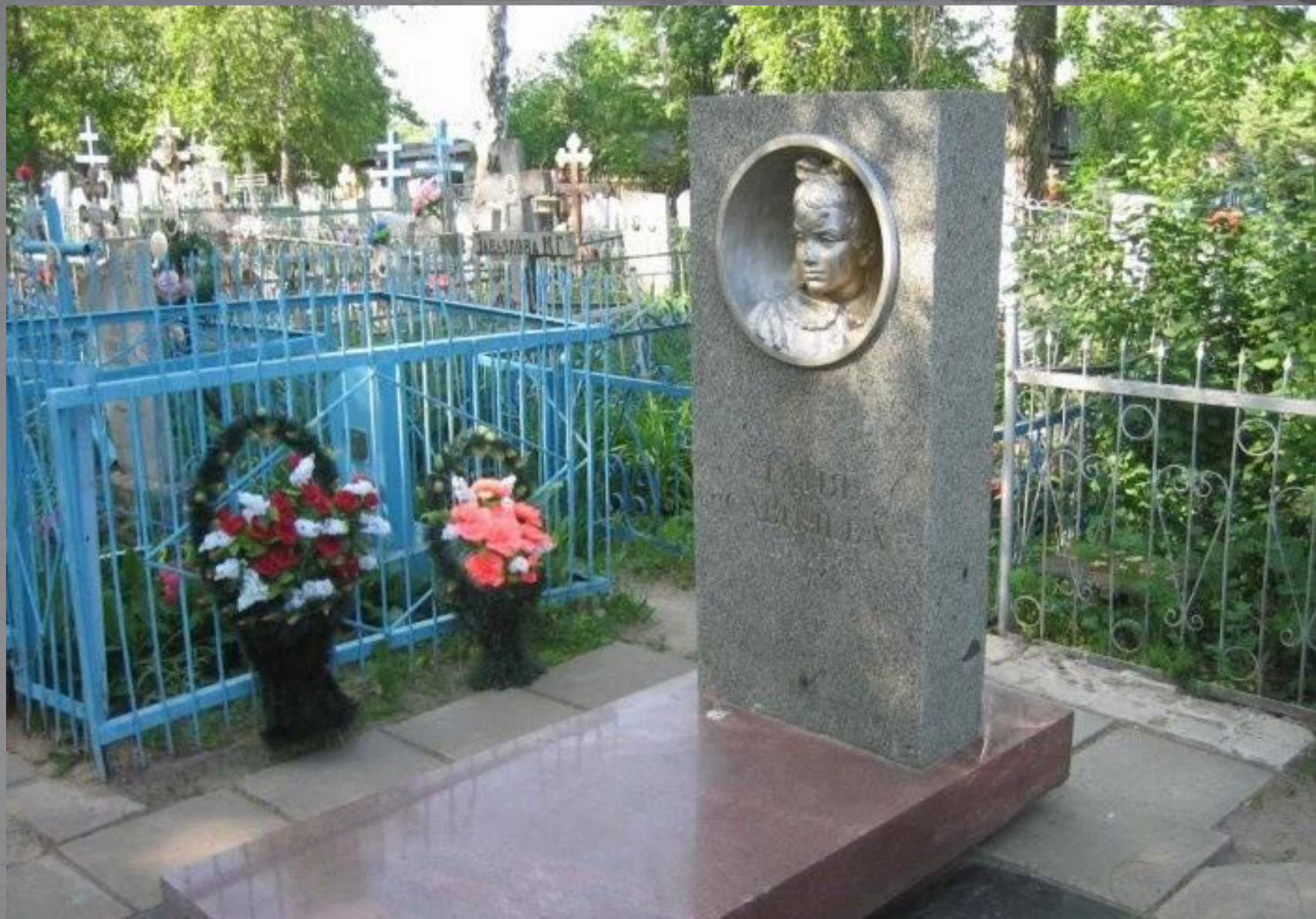
Шатки, Могила Тани Савичевой.