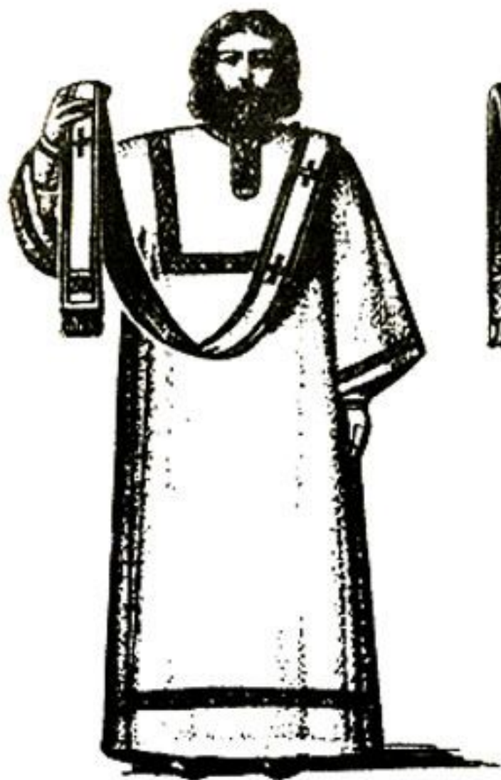
Діаконъ въ облаченіи