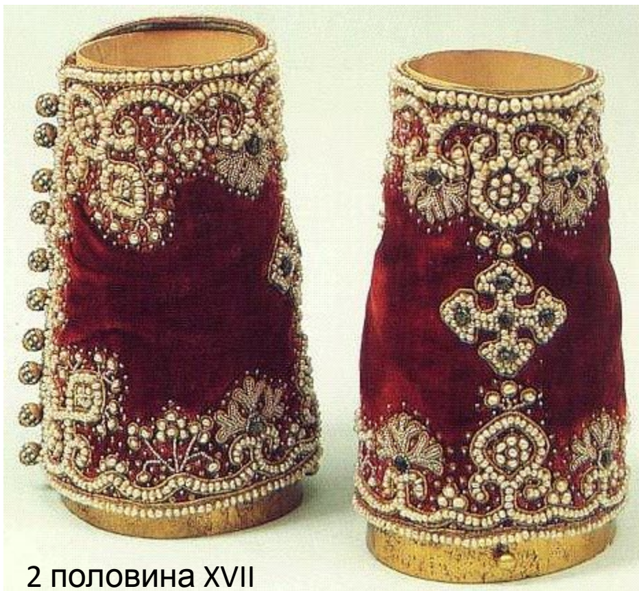
2 половина XVII века

Поверх епитрахили и подризника священники надевают специальный пояс , имеющий несколько символических значений, в том числе напоминание о полотенце, которым препоясался Иисус Христос, когда омывал ноги своим ученикам.