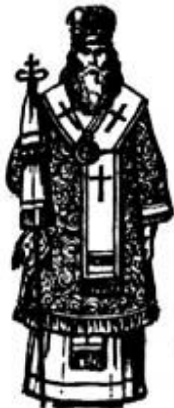
Епископъ въ облаченіи.