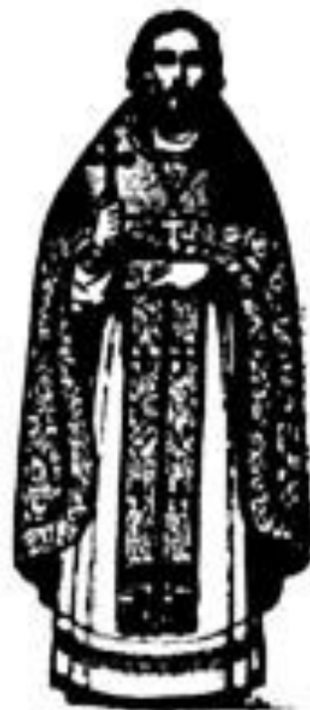
Священникъ въ облаченіи.