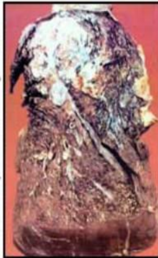
Больная ткань легкого