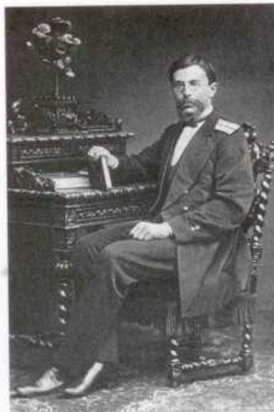
Счастливое семейство Римских-Корсаковых: Надежда Николаевна и Николай Андреевич. У них было семеро детей. Фото 1870-х годов

На одном из вечеров Римский-Корсаков знакомится с очаровательной пианисткой Надеждой Пургольд. Долгие романтические прогулки в окрестностях ее дачи в Парголово, совместное чтение и проигрывание музыкальных произведений... Николай Андреевич понимает: эта девушка – его судьба, пора делать ей предложение.