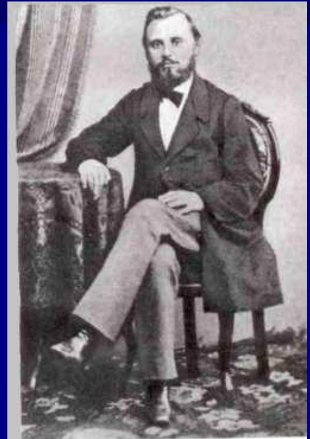
Милий Балакирев. Таким он был, когда создавался Балакиревский кружок. 1860-е годы