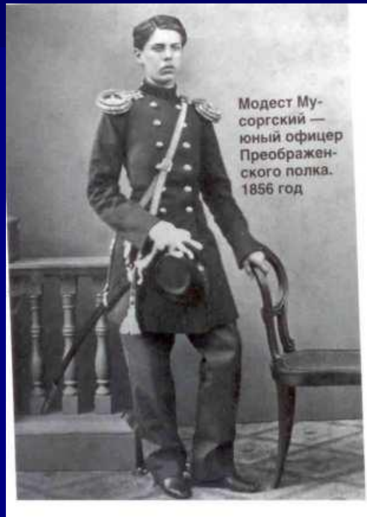
Модест Мусоргский — юный офицер Преображенского полка. 1856 год

А начиналось все идиллически – Мусоргский стал третьим постоянным участником балакиревских музыкальных вечеров. Случилось это в 1857г., когда будущему гениальному композитору было все лишь 17 лет. Родина его – село Карево на Псковщине. Русская глушь, где сам «дух народной жизни», как говорил Модест Петрович, сохранился в неприкосновенности. Первые музыкальные опыты Мусоргского проходили дома под руководством матери. Десяти лет от роду потомка старинного дворянского рода отвезли в Петербург, в Школу гвардейских подпрапорщиков.