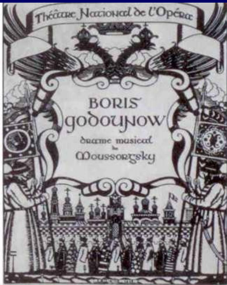
Обложка программы спектакля "Борис Годунов" для дягилевского "Русского сезона" 1908 года. Рисунок Ивана Билибина