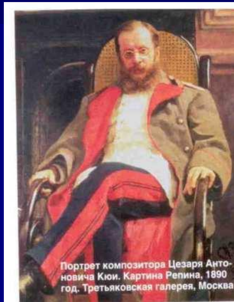
Портрет композитора Цезаря Антоновича Кюи. Картина Репина, 1890 год. Третьяковская галерея, Москва

Вообще-то Цезарь Антонович Кюи был на два года старше Балакирева. И к 1856г., когда юный музыкант только завоевывал столицу, он уже окончил солидную Инженерную академию. Кюи хорошо разбирался в музыке, играл на скрипке и фортепиано и даже пробовал сам писать. В его родном городе Вильно гармонией с ним занимался знаменитый польский композитор Станислав Монюшко.