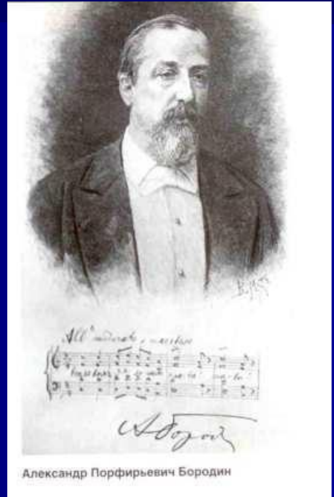
Александр Порфирьевич Бородин

Отцом Саши был грузинский князь Лука Гедианов, а матерью – петербургская мещанка Авдотья Антоновна. Фамилию и отчество мальчик получил от одного из крепостных отца. Но внешность и темперамент выдавали в нем наследника грузинского княжеского рода. Видимо, этим и объясняется выбор профессии, ведь химия – одна из немногих наук, где все бурлит, горит и взрывается законно, для пользы дела. Саша оказался разносторонне одаренным ребенком – с 8 лет играл на флейте, фортепиано и виолончели, а с 9 начал сочинять музыку.