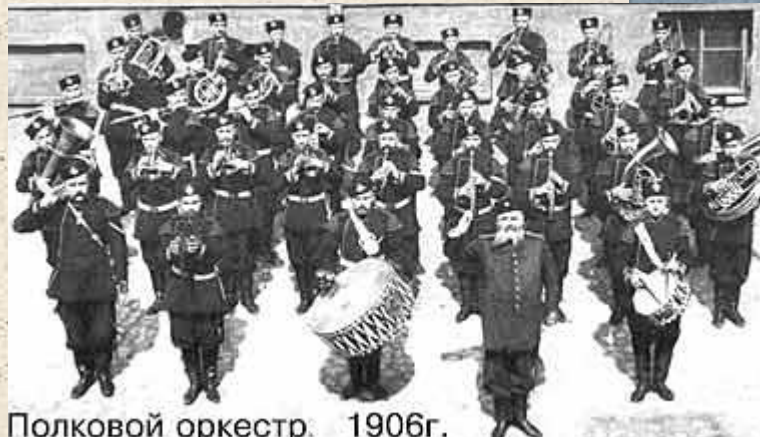
Полковой оркестр. 1906г.