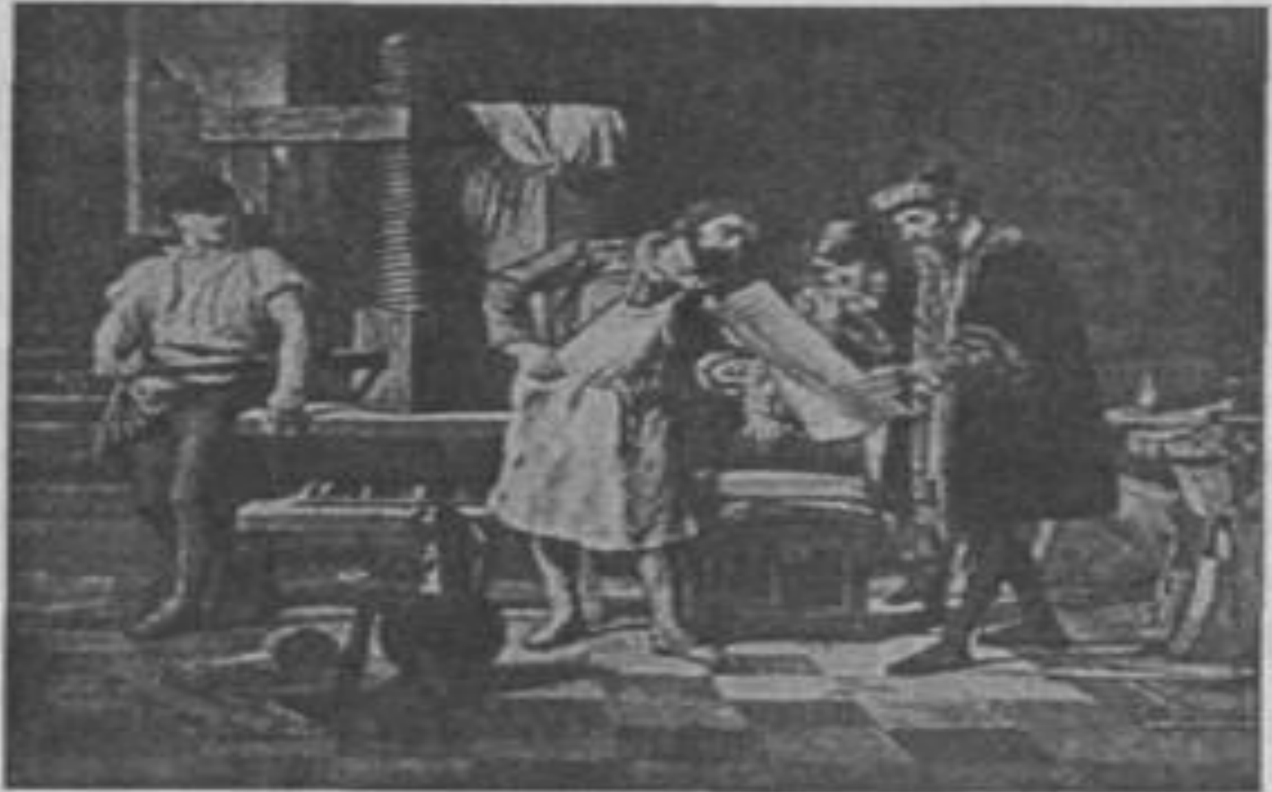
Гуттенберг рассматривает отпечатанную страницу