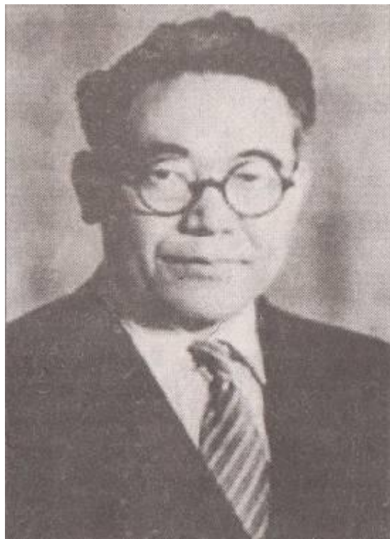
Тойода Киичиро – основатель компании Toyota Motor Corporation

Киичиро является продолжателем дела своего отца, по его наказу он четыре года упорно перебирал по винтикам европейские авто , пока в 1935 году не выпустил свой первый автомобиль А1 или АА. Но первые 20 автомобилей были еле-еле проданы. И все-таки упрямый Тойода в 1937 году основал фирму, получил лицензию и приступил к выпуску грузовиков. Японские автомобили затмили американские!