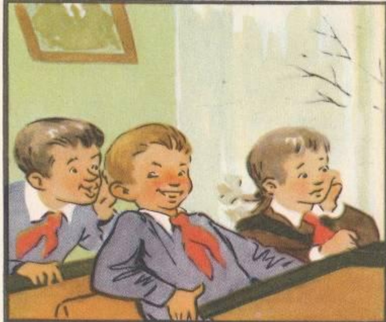
на уроках грамматики внимательно слушал,