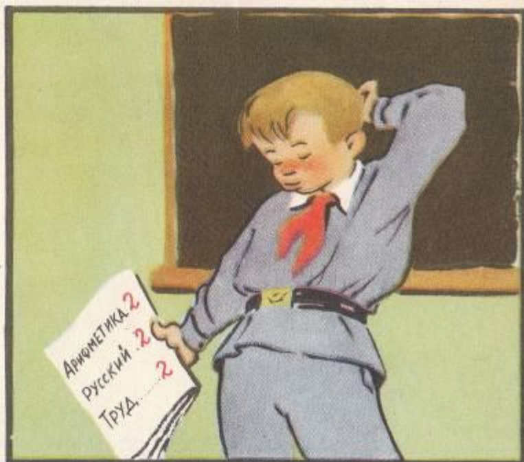
...но почему-то все время получал двойки