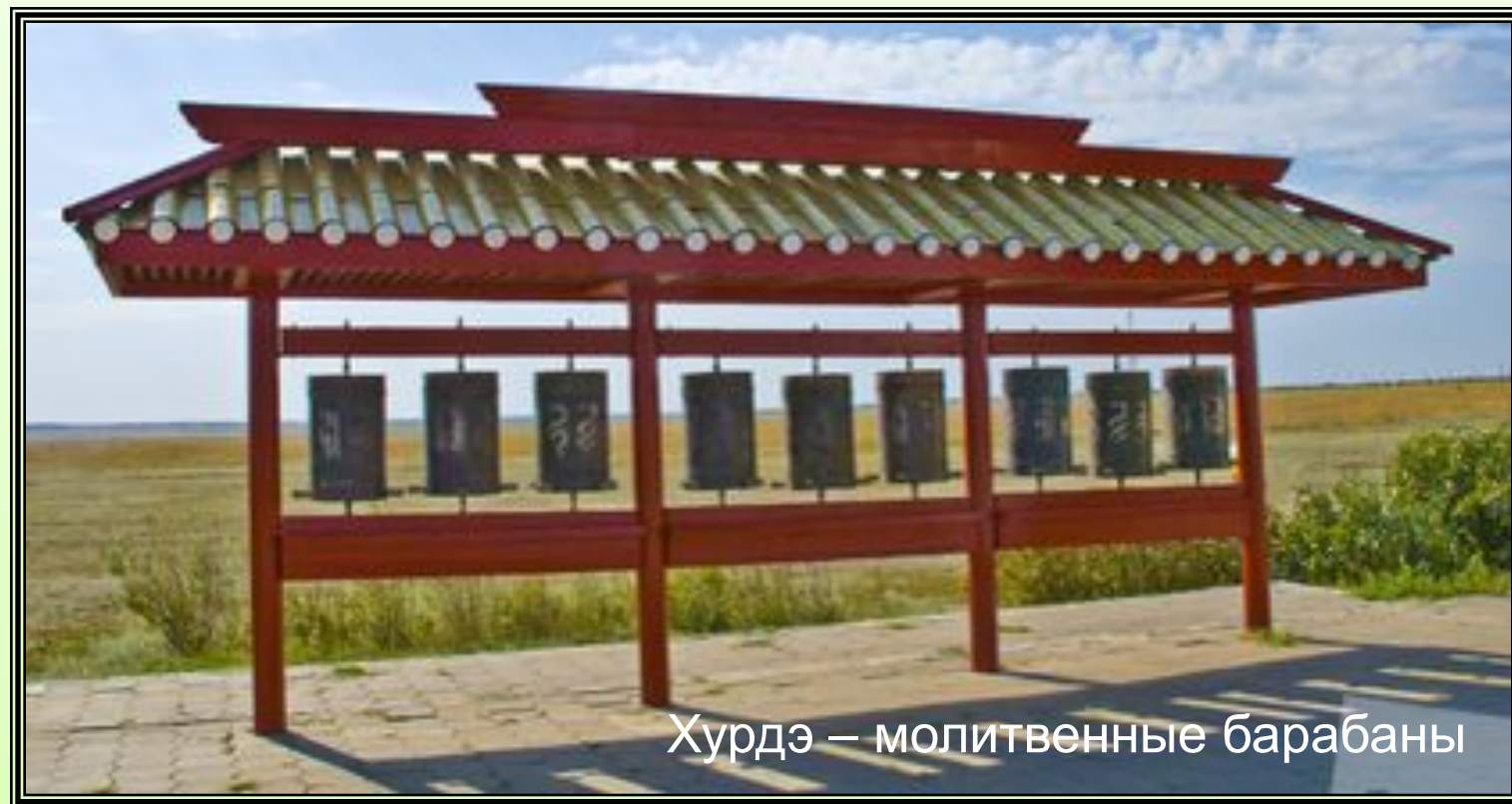
Хурдэ – молитвенные барабаны

Ламаизм – Тибет VII в. Уход от мирской жизни и созерцание сочетаются с магией и верой в многочисленные местные божества, ритуальностью и полным подчинением ученика учителю-ламе