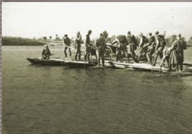
Советские бойцы форсируют Днепр

В результате четырёхмесячной операции левый берег Днепра был освобождён Красной Армией от немецких захватчиков. В ходе операции значительные силы Красной Армии форсировали реку, создали несколько плацдармов на правом берегу реки, а также освободили город Киев.