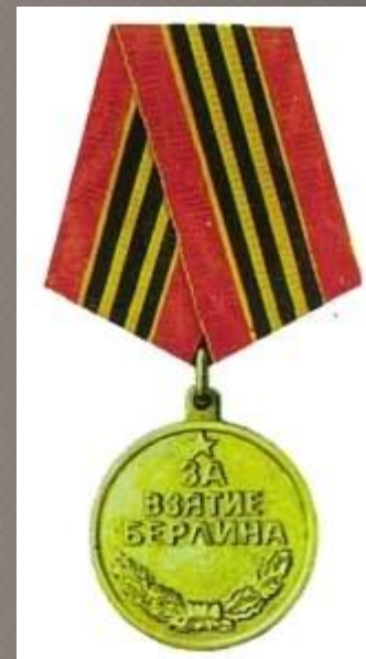
Медаль «За взятие Берлина»