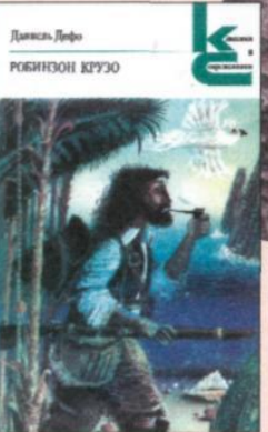
Обложка современной книги. Худ. В Гошко