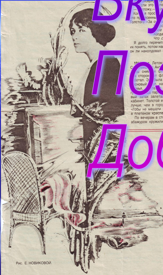
Рис. Е. НОВИКОВОЙ.