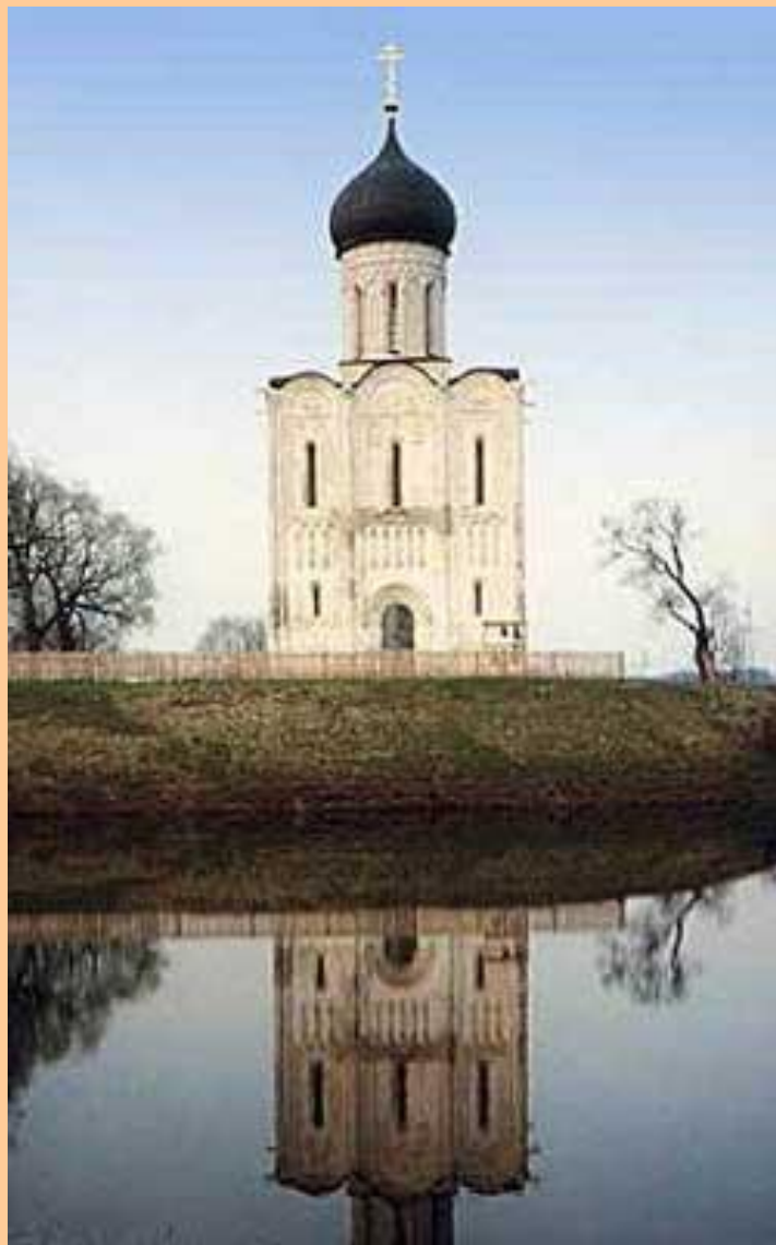
Храм Порова на Нерли (фото)