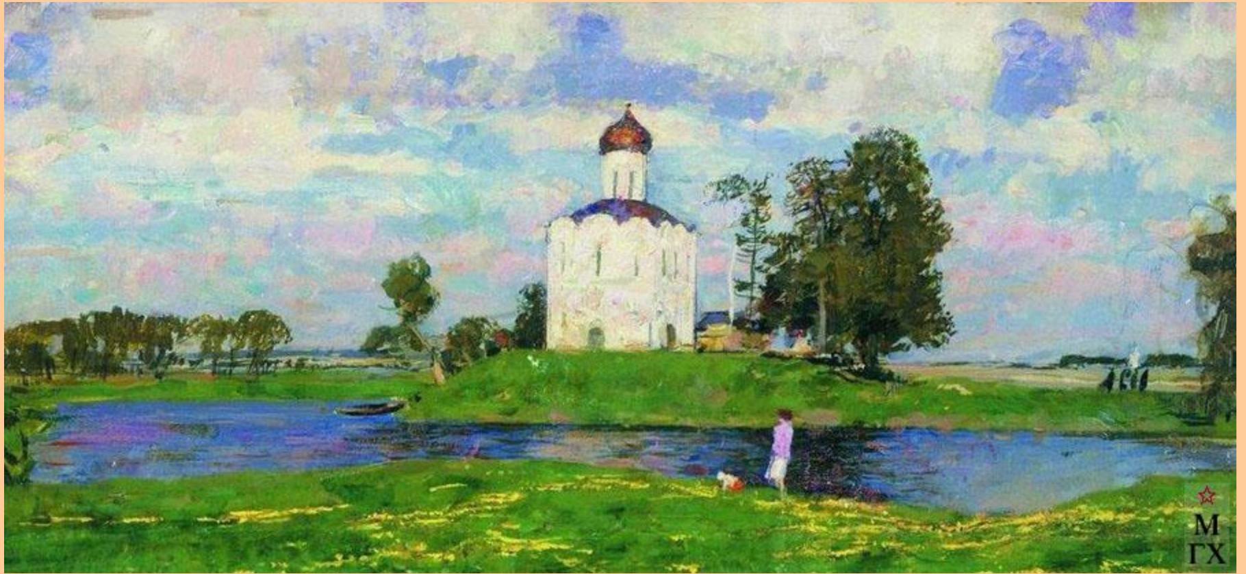
С.В.Герасимов "Церковь Покрова на Нерли".