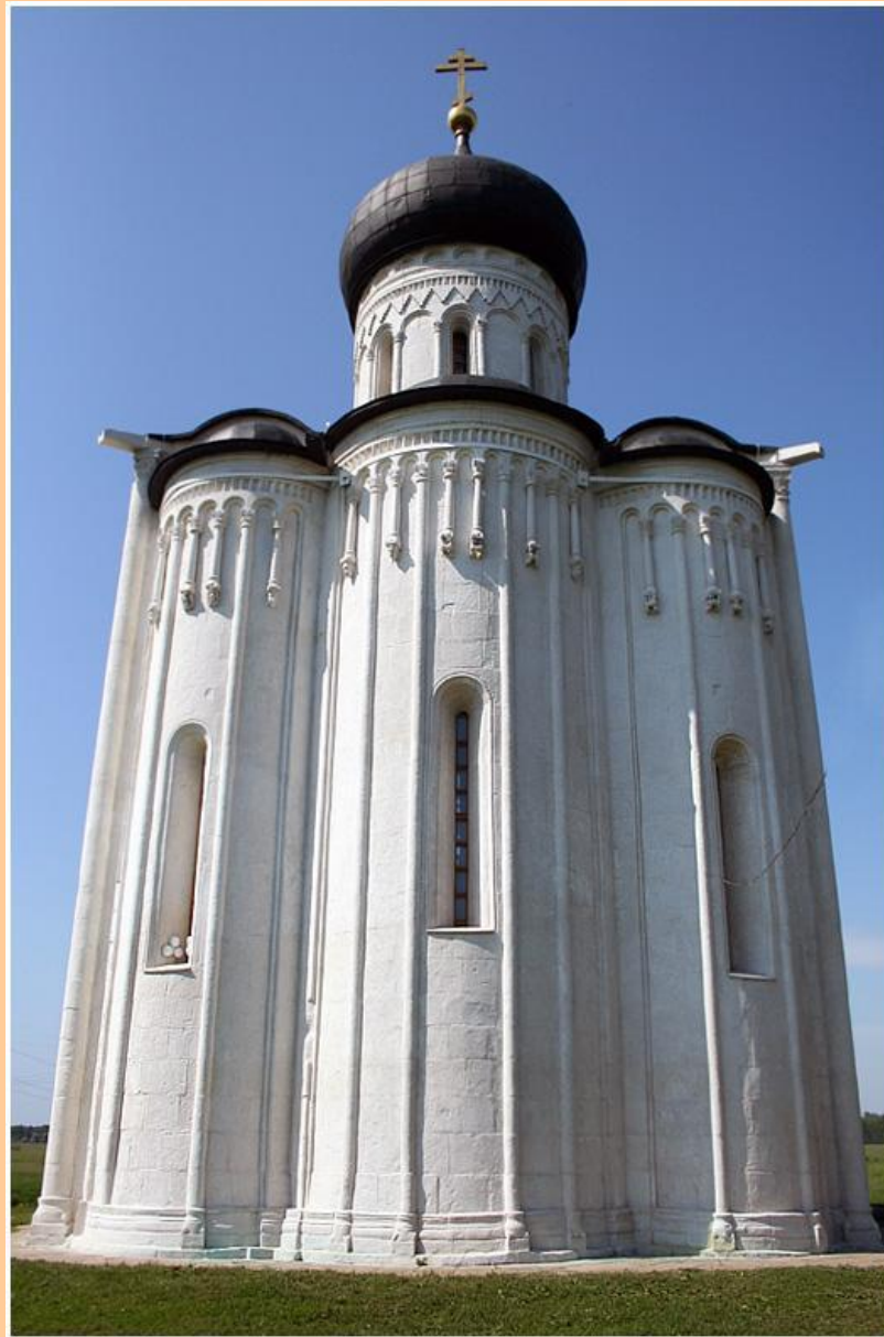
Храм Порова на Нерли (фото)