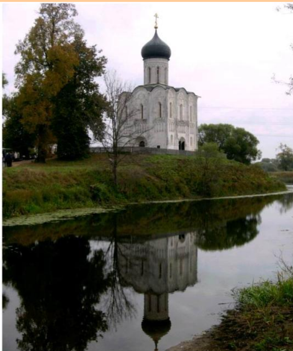
Храм Порова на Нерли (фото)