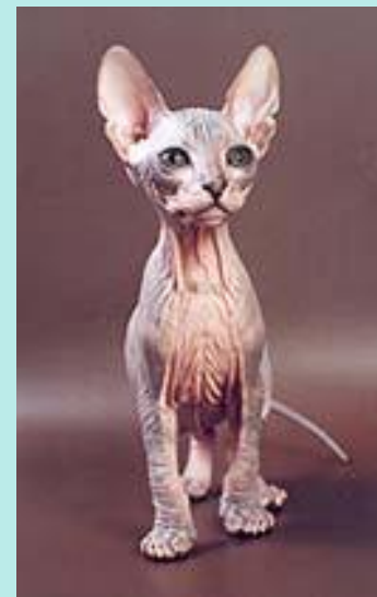
донской сфинкс (или донской лысак)