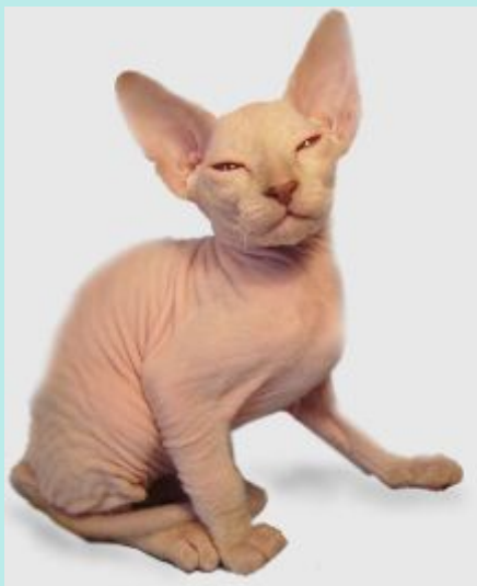
петербургский сфинкс (или петерболд)