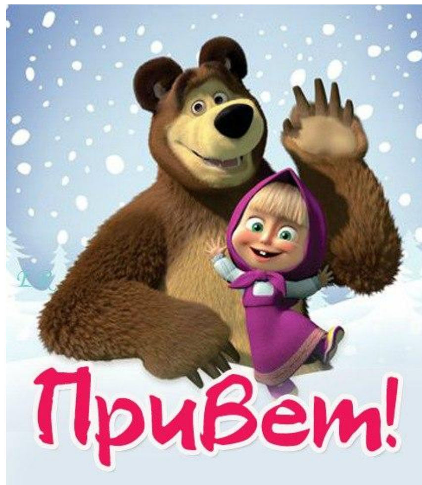
Маша и медведь