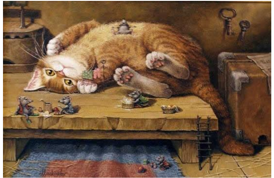
О Ваське - Муське