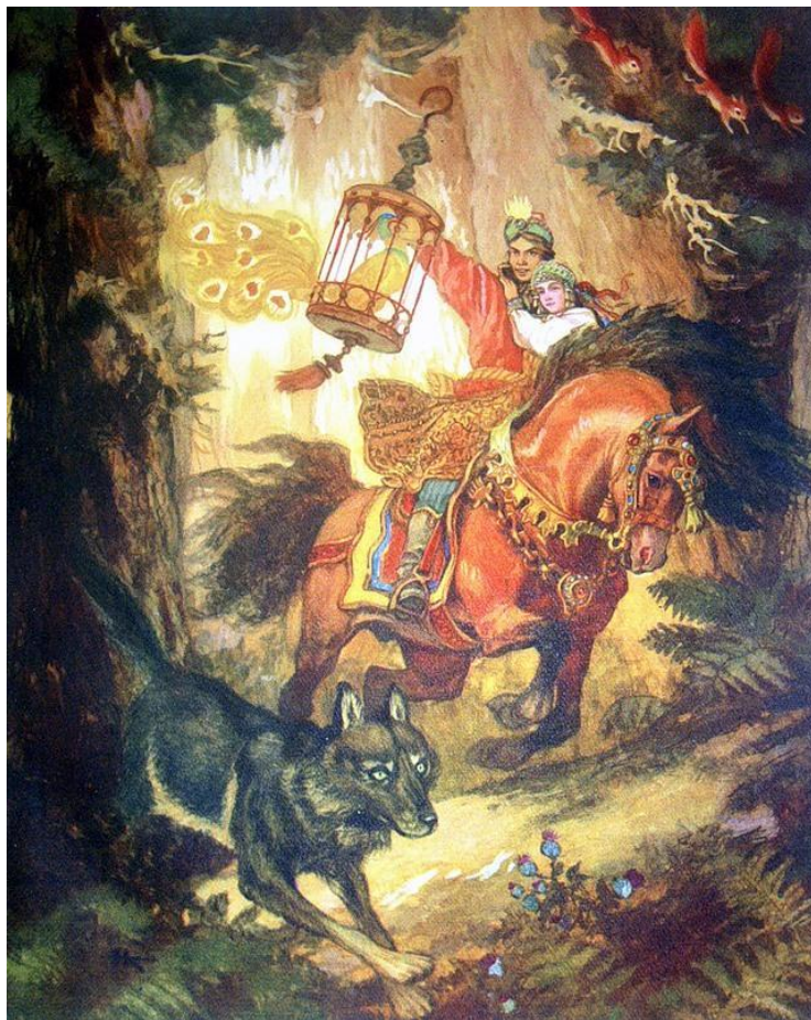
Иван царевич и серый волк

Назовите название русских сказок, в которых встречаются имена.