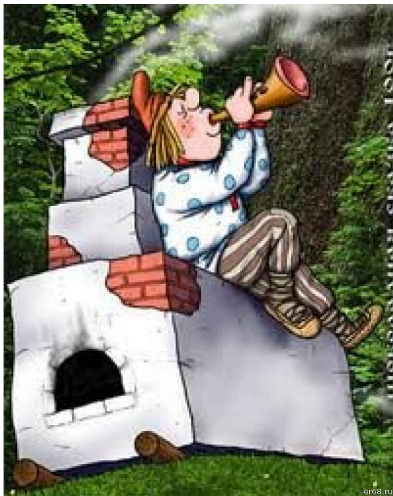
Емеля - дурак