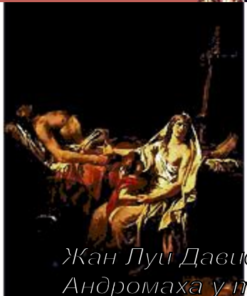
Жан Луи Давид. Андромаха у тела Гектора.