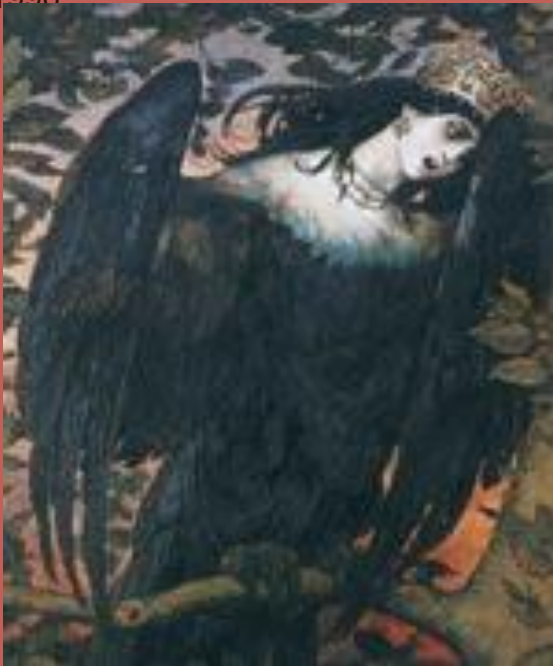
Сирина (фрагм) Виктор Васнецов

Сирина - это одна из райских птиц, даже самое ее название созвучно с названием рая: Ирий.