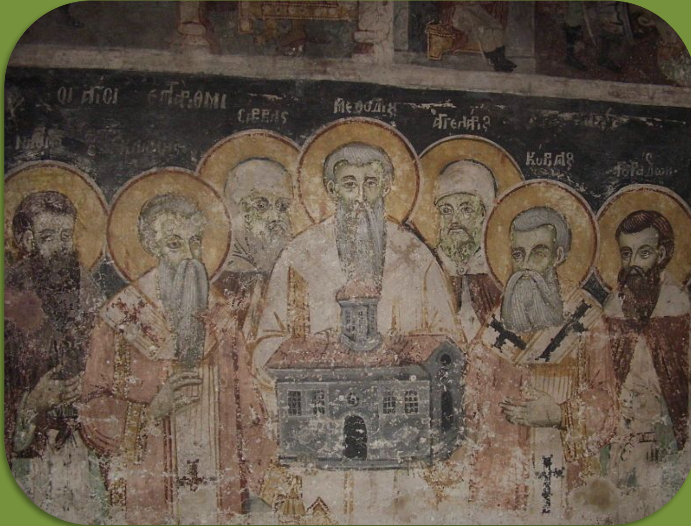
Фреска монастыря «Святой Наум»(в Республике Македонии).