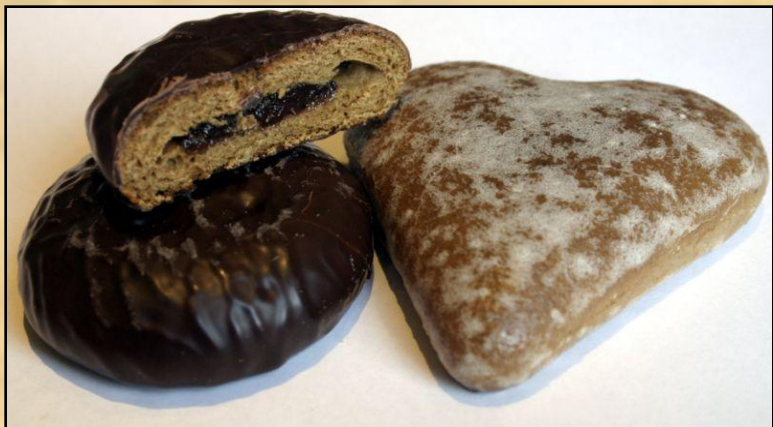
Традиционные польские пряники