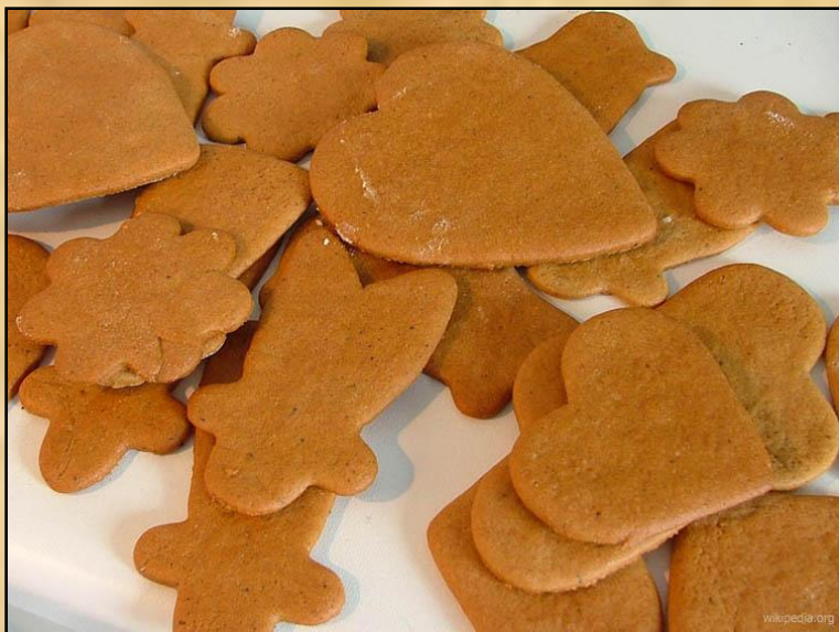
Немецкие рождественские пряники