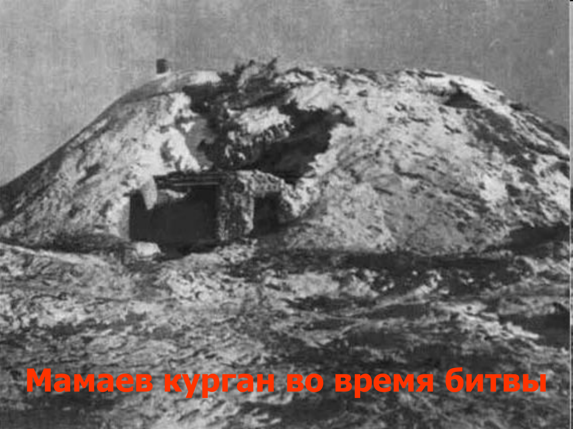
Мамаев курган во время битвы