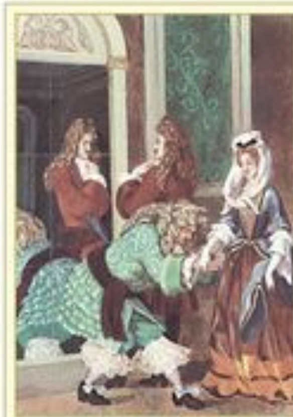
Иллюстрация к комедии Ж. Б. Мольера 'Мизантроп' из дворцовой Художник А. Аронов