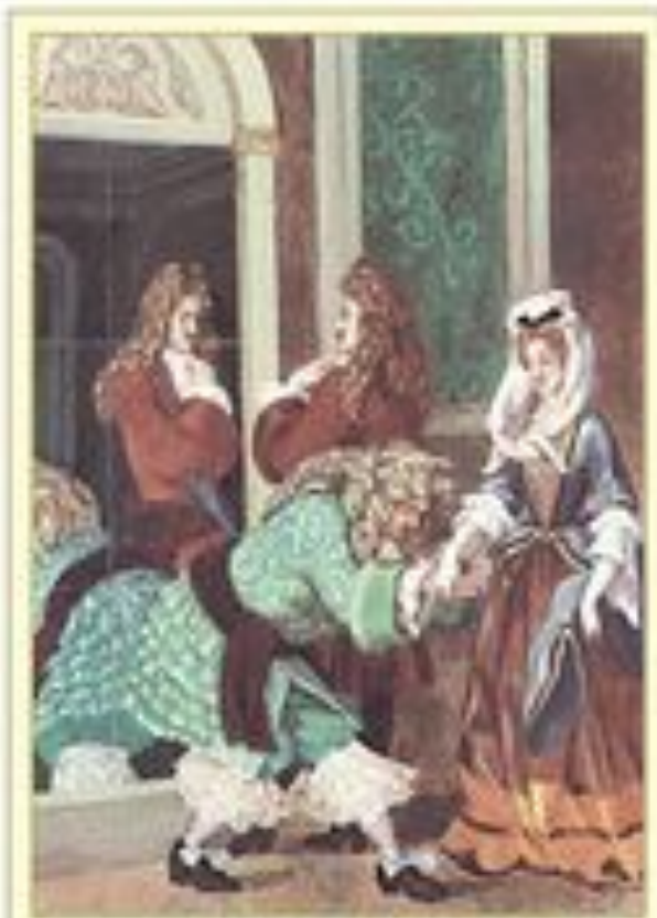
Иллюстрация к комедии Ж. Б. Мольера "Мизантроп" из дворцовой Художник А. Архипов