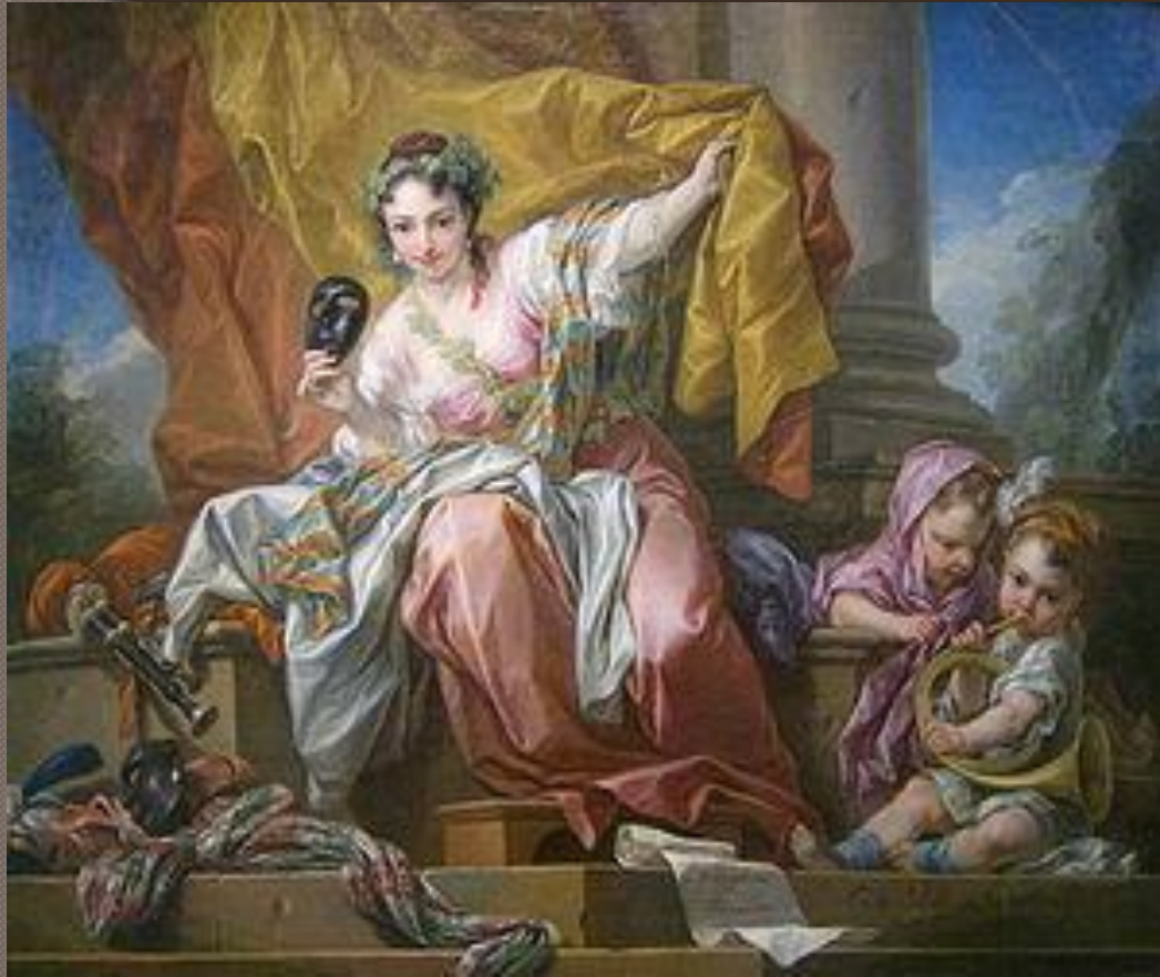
Аллегория комедии Ванло, 1752.