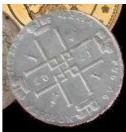
копейка в X веке