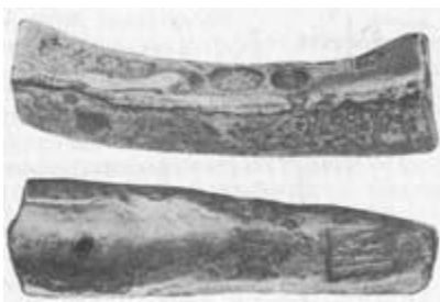
рубль в XIII веке