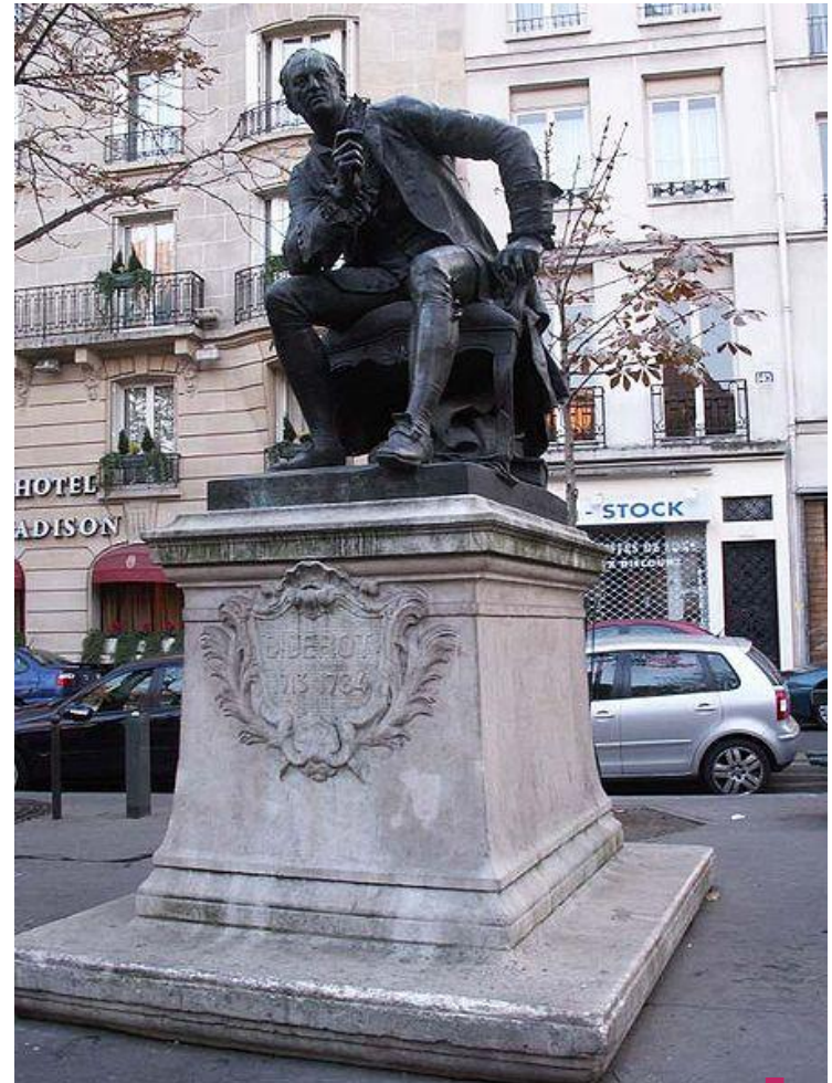
Памятник Д.Дидро в Париже