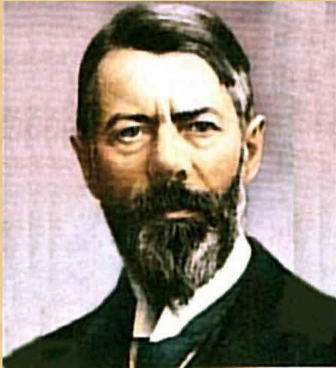
М.Вебер (1864-1920 гг.), немецкий социолог, экономист, юрист

«Действием называется человеческое поведение в том случае и постольку, если и поскольку действующий индивид или действующие индивиды связывают с ним субъективный смысл».