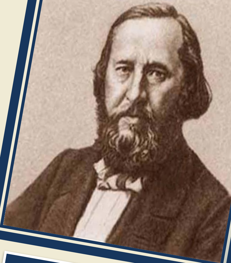
Аксаков К. С.