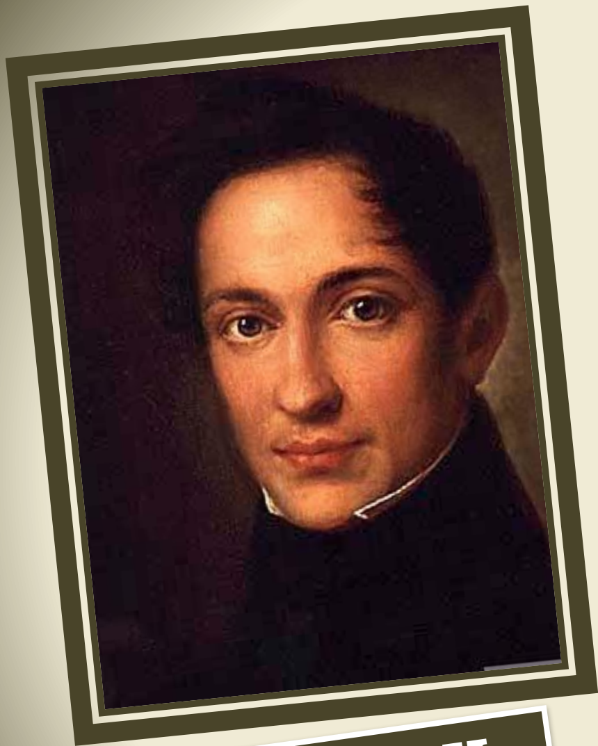
Герцен А. И.