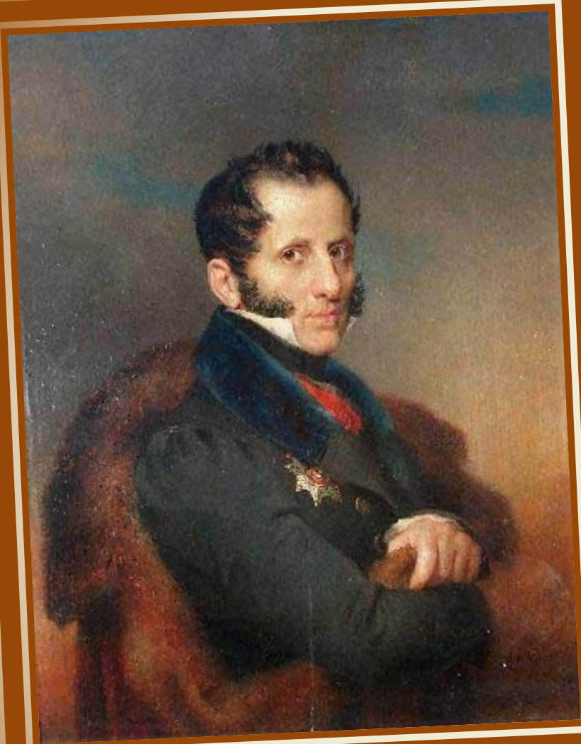
Уваров С. С.