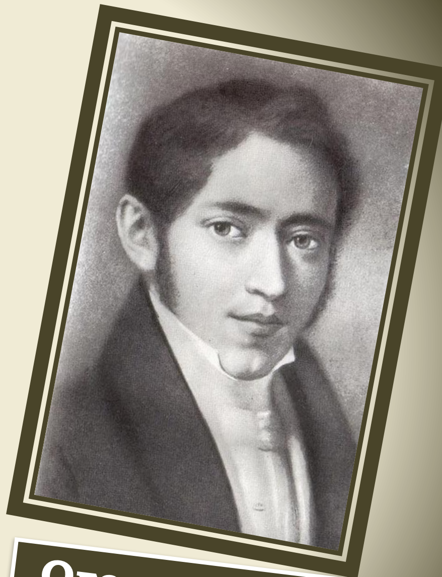
Огарев Н. П.