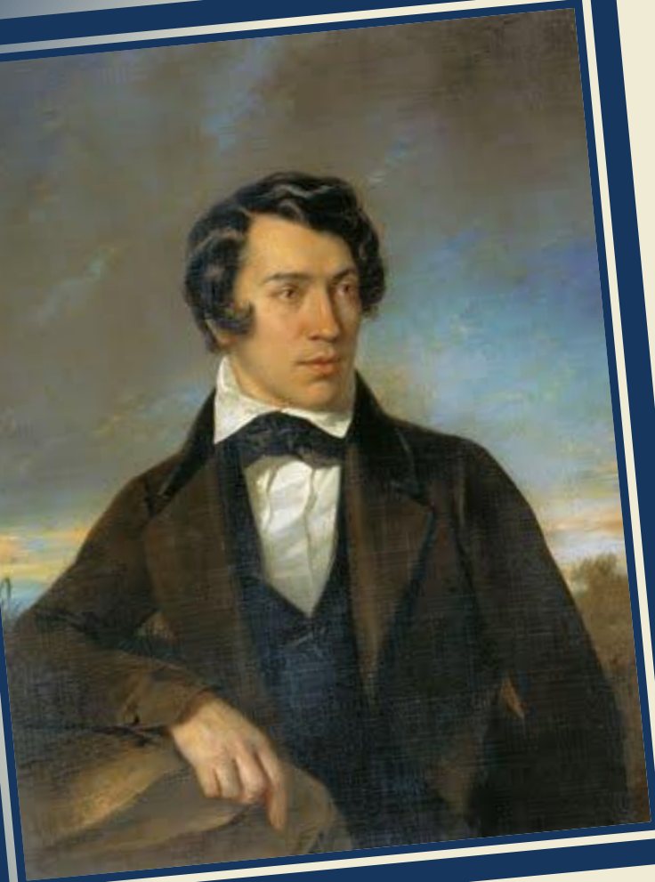
Хомяков А. С.