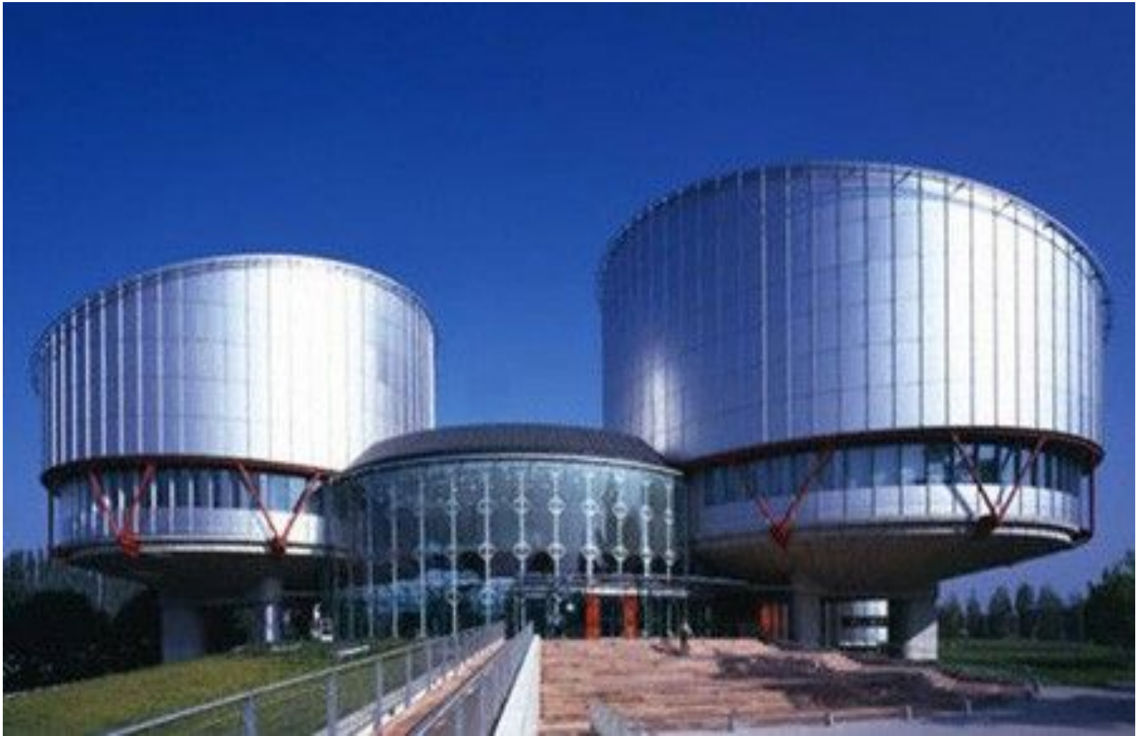
Здание Европейского суда по правам человека