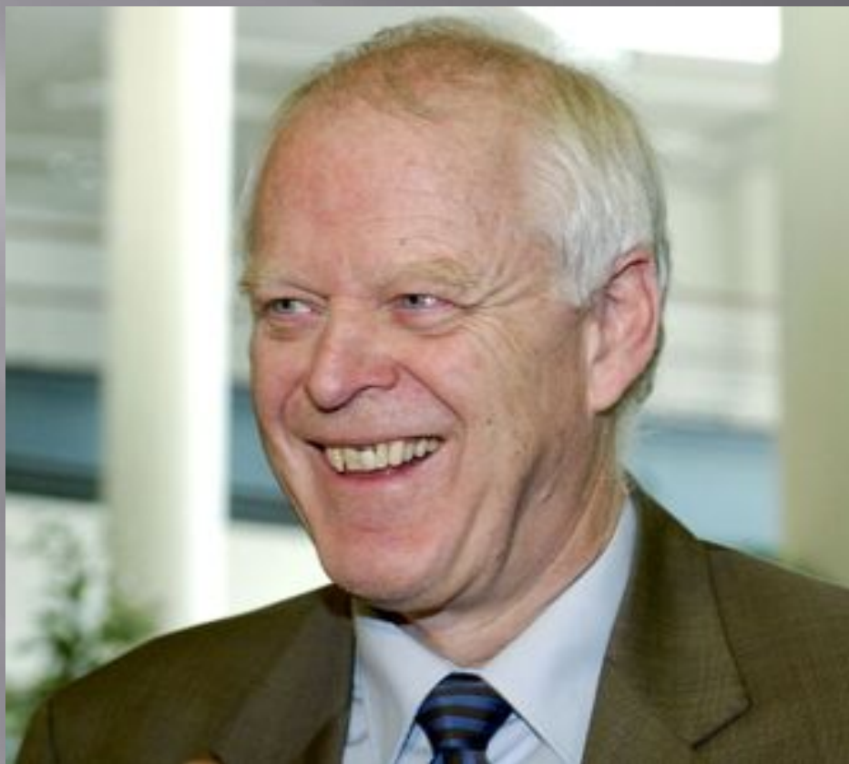
Комиссар по правам человека Совета Европы Томас Хаммарберг.