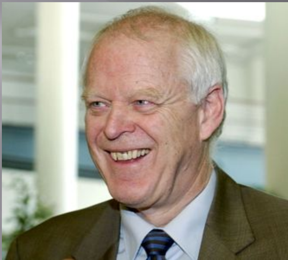
Комиссар по правам человека Совета Европы Томас Хаммарберг.