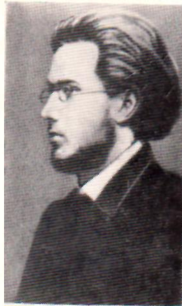
ЛОПАТИН Герман Александрович (1845—1918)

Ставропольцы чтят память о знаменитом своем земляке. Около бывшей гимназии (ныне Высшее военное командное училище связи) будет установлена скульптура Г. А. Лопатина. Пока не найден дом, в котором жил его отец, председатель Казенной Палаты. Но в Октябрьском районе города есть улица, где, по рассказам старожилов, была дача его семьи. Эта улица и носит имя Германа Лопатина.