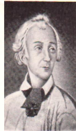
СУВОРОВ Александр Васильевич

Имя одного из основателей русского военного искусства, генералиссимуса Александра Васильевича Суворова останется навечно дорогим не только как образец патриотизма, беззаветной отваги и умения побеждать, но и как пример мудрой гуманной политики, положившей начало дружбе между русским и горскими народами.