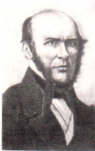
ПИРОГОВ Николай Иванович (1810—1881)