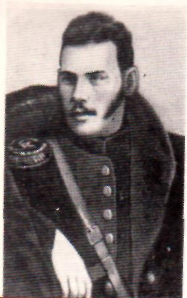
ТОЛСТОЙ Лев Николаевич (1828—1910)