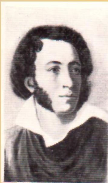
ПУШКИН Александр Сергеевич (1799—1837)