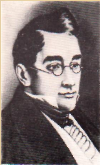
ГРИБОЕДОВ Александр Сергеевич (1795—1829)